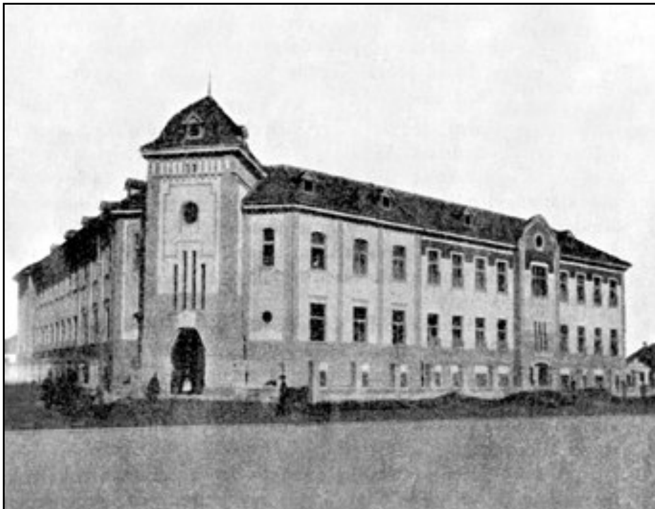
ÁLLAMI ELEMI NÉPISKOLA

Az egyes iskolacsoportok a telep területén úgy helyeztettek el, hogy a körzetükbe tartozó óvó- és tanköteles gyermekek könny-