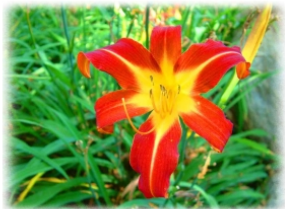
A Szerelmemvirág természetesen piros