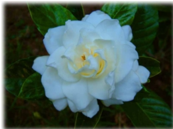
A Fény-virágok az est lámpásai