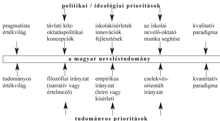
2. ábra. Politikai és tudományelméleti prioritások a hazai pedagógiai kutatásokban. (Báthory, 2000. 26.)

felfogás követői a kísérleti pedagógia hagyományához kapcsolódnak. S létezik egy harmadik törekvés, amely az aktuális pedagógiai problémák föltérképezésére és megoldási módszereinek kidolgozására vállalkozik. E cselekvésorientált irányzat mentén – ha nem is annak a kizárólagos képviselőjére – formálódik az Iskolakultúra.