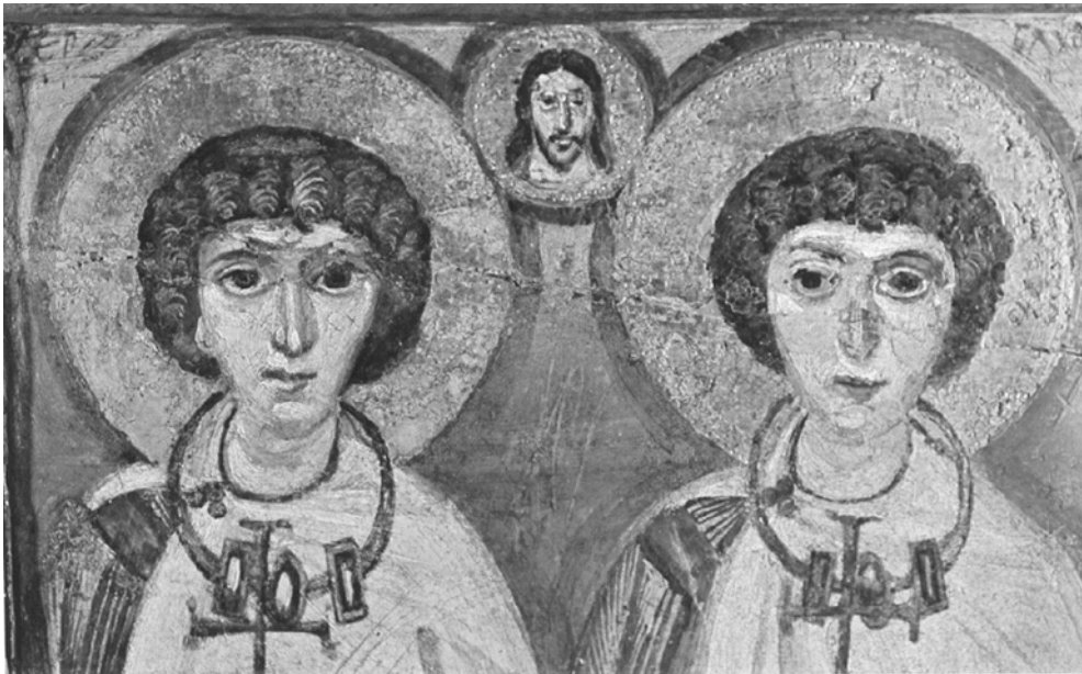
Két férfi, Szt. Sergius és Szt. Bacchus esküvője, mögöttük Jézus, az esküvői tanú

„társadalmilag veszélytelenek” voltak. Ebben a férfiuralmi rendszerben a saját szexualitásáról önrendelkező nő – így a leszbikus nő is – elképzelhetetlennek tűnt. A „gyógyítható leszbikus” képe élt a náci fejekben, és a lesbizikusság amúgy sem állt ellentétben a gyermeknemzés hazafias feladatával, hisz a nőkről úgy gondolták, hogy akaratuk ellenére, vagyis nemi erőszak útján is teherbe ejthetők. A leszbikus nőket általában valamely társult „bűnük”, zsidó vagy kommunista voltak alapján deportálták. Másokat aszociálisnak bélyegezve hurcoltak el, ami a legtöbb esetben csak annyit jelentett, hogy nem voltak hajlandók házasodni és szülni. Leszbikus túlélők visszaemlékezéseiből tudjuk, hogy táborbeli „átnevelésükhöz” a többi borzalom mellett hozzá tartozott a sorozatos nemi erőszak. 4