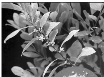
A koka cserje és a kokain

Gyakori a kemény, illetve lágy drogok elkülönítése. Ez az elkülönítés eredendően a holland drogpolitikai gyakorlatból származik. Hollandiában, 1976-ban úgy döntöttek, hogy a kannabisz-származékokat, azaz a marihuánát és a hasist leválasztják az egyéb szerekről, s enyhébb megítélés alá vonják. Ezt az elkülönítést az indokolta, hogy a kannabisz kisebb valószínűséggel alakít ki függőséget, illetve használatának egészségügyi és társadalmi kockázata lényegesen alacsonyabb, mint az egyéb, keménynek nevezett drogoké. Az elkülönítés révén a hollandok elérték, hogy különvált a marihuána és a heroin piaca, s ezáltal jelentősen csökkent a heroint használók aránya. Fontos azonban tudni, hogy a holland eredmények egy komplex beavatkozás eredményeként jöttek létre. A kemény és lágy drogok elkülönítésének veszélye mindazonáltal az, hogy a kannabisz-származékokra így gyakran nem mint kevésbé veszélyes , hanem, mint veszélytelen szerekre szokás hivatkozni, ami alapvetően hibás megközelítés. Relatív , azaz a heroinhoz és más kemény drogokhoz viszonyított, nem pedig abszolút veszélytelenségről van szó.