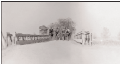
Az öreg fahíd