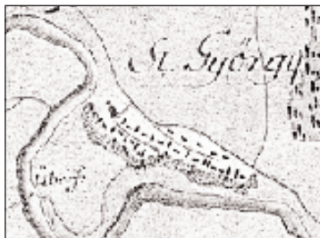
Térképek 1840 és 1770-ből