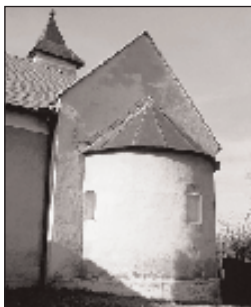
Árpád-kori templom szentélye

vize, csak 16 jobbágytelek (szesszió) maradt épen. 1558-ban a törökök kifosztották a községet. Az 1559 - 1561 - es összeírásban szerepel, hogy a község bizonyos Mathusnay birtoka (valószínűleg kapitány volt itt). 1571-ben a megye keretébe tartoztak: Felső- és Alsóoroszi, Bernece, Felsőweszele és