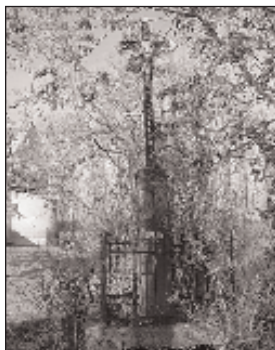
A templomkertben álló kereszt

készítették. Magas talapzatra van illesztve, melyről hiányzik a felirat és az évszám. A temető római katolikus részének központi keresztje korpuszal, szintén valószínűleg a 20. század elejéről, magas talapzaton áll, erről is hiányzik a felirat és az évszám. A volt r.k. iskola előtt látható az I. világháború áldozatainak emlékműve , melyet feketemárványból készítettek 1926-ban. Az obeliszk alakú objektumra, amely lépcsőzetes talapzatra van helyezve, 33 áldozat nevét vészték. Az emlékművet a lévai Lővinger cég készítette. Mellette áll a II. világháború áldozatainak emlékműve , melyet 1996-ban készítettek. Alacsony, négyzet alakú talapzatra helyezték, kőből készült, s 29 áldozat neve van rávésve. A helyi temetőben van a Csekő család kis mauzóleuma , 1956-ban építették. Téglalap alakú épület ormos főhom-