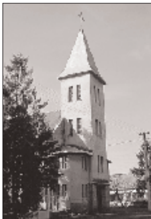
Az evangélikus templom

om használatáért a Garamon, ugyanúgy Mahmúd, az esztergomi lovasok agája egykerék-meghajtású malmának használatáért a Garamon a ser'-jegyzék szerint, a nagysallói és a kissároi határban a keresztények (ráják) által használt rétekért és legelőkért. Tehát mindenért fizetni kellett. Új családnevek jelentek meg az összeírásban: Balogh, Kósa, Mónár, Pap, Tóth, Varga, Jakab, Deák és Pásztor. Az adókat és az illetekeket a községi bírónak kellett beszednie, ezért a török megszállás idején ezt a tisztséget senki nem akarta betölteni. Ha nem teljesítette kötelességeit a törökök megalégedésére – őt büntették meg. A község az érsekújvári török kormányzóság (ejálet), Bars megye török helytartósága (náhije) és az érsekújvári közigaz-