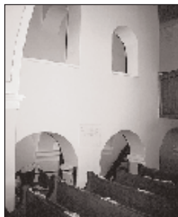
Az Árpád-kori templom belső tere

vize, csak 16 jobbágytelek (szesszió) maradt épen. 1558-ban a törökök kifosztották a községet. Az 1559 - 1561 - es összeírásban szerepel, hogy a község bizonyos Mathusnay birtoka (valószínűleg kapitány volt itt). 1571-ben a megye keretébe tartoztak: Felső- és Alsóoroszi, Bernece, Felsőweszele és