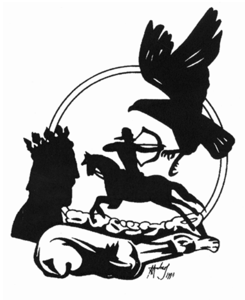
Molnos Zoltán rajza