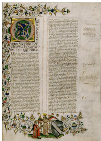
2. ábra 24 bites verzió

Minden más szöveges forrást szöveggként érdemes digitalizálni, ugyanis míg a képfórmátumban nem, vagy csak körülményesen lehetséges a „szövegkeresés”, a szöveges digitalizáció esetében (pl. egy lexikonnál) fontos, hogy a képpoldalak ne csak nézhetőek/olvashatóak legyenek, hanem adott esetben tetszőleges karaktercsoportokra – szövegre – kereshetővé váljon a digitalizált dokumentum. 90