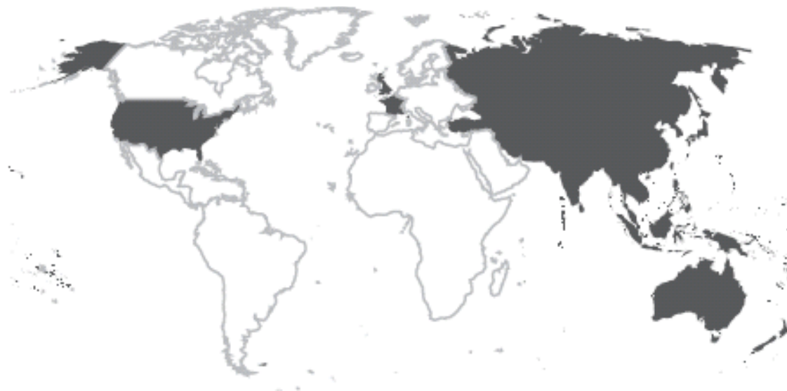
3. ábra ESCAP tag- és társult országok térképe