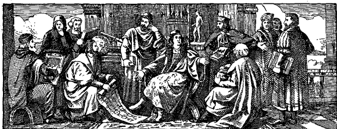
Mátyás király tudósai körében.

A könyvkedvelő bölcs király halála után azonban véget ért a könyvtár gyarapodása.