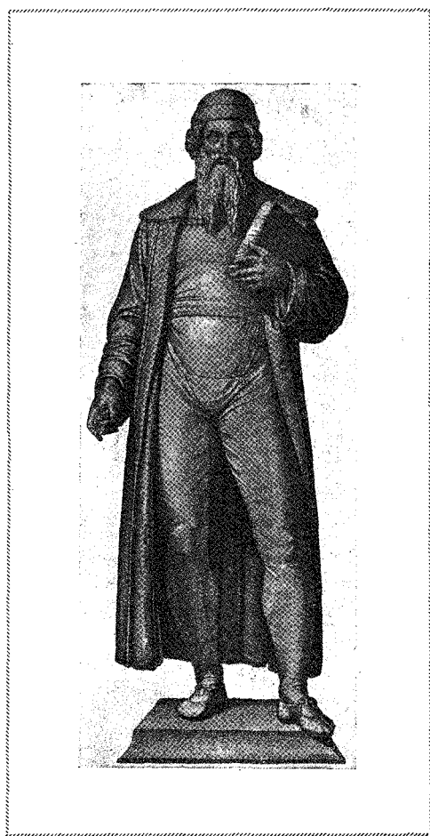
GUTENBERG MAINZI SZOBRA