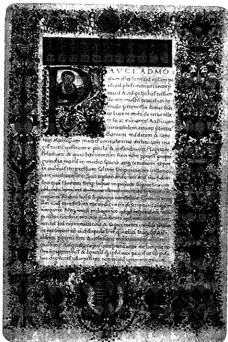
Egy Corvin-kódex címlapja.