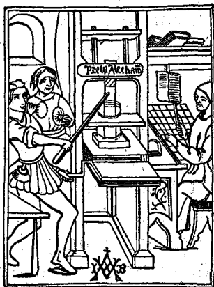
Az első nyomtató gép.

a feltételt és berendezte a műhelyt. Csak-hogy a jólelkűnek mutatkozó társ, mikor a találmánnyal már tisztában volt, valami ürüggyel elvitte Gutenberg János legértékesebb anyagát és egy rokonával hamarosan berendezett egy könyvnyomtató műhelyt. Az első nyomtatott könyv csakugyan innen került ki, ezzel a végszóval: «Ez a könyv a nyomtatás művészi találmánya és a betű alkotása segítségével készült, minden tollvonás nélkül, Isten tiszteletére Fust és Schöffer szorgalma által, az Úr 1457-ik esztendejében Mária mennybemenetele napján». Innen van, hogy még ma is használják a könyvnyomtatók e jelszót: «Isten, dicsérd a művészetet.»