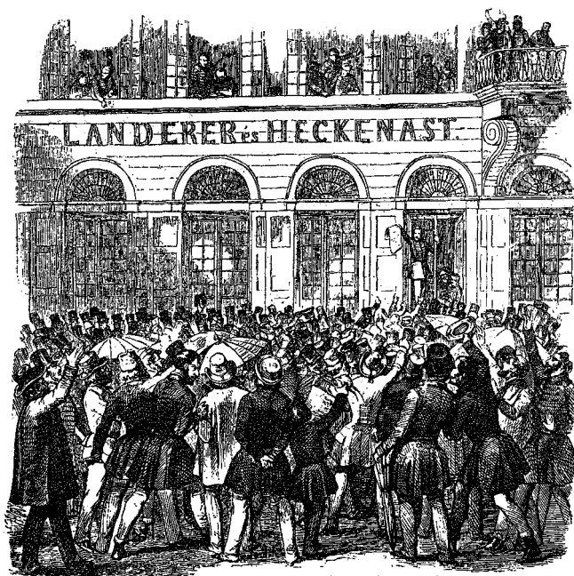
A sajtószabadság első művét megmutatják a népnek.

munkához. A folytonosan behallatszó éljenzés közben először a Talpra magyar! került a gépbe, melynek első példányát riadó örömmel fogadta a tömeg.