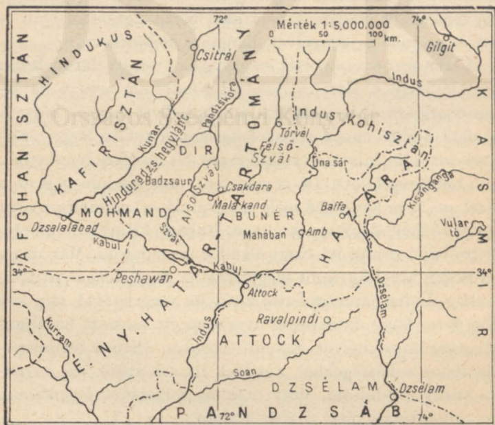
Stein Aurél 1926-i kutató útjának színtere.

Itt, ahonnet kiindult benyomulása a tulajdonképpeni Indiába, el kell búcsúznunk a nagy hódítótól. Itt véget is ér beszámolómm arról, miképpen nyomoztam ki színhelyeit annak a hadjáratnak, amely megelőzte Nagy Sándor indiai diadalútját és amely, ha a leküzdött természeti nehézségeket tekintjük, még fényesebb bizonyítékát adta hadvezéri géniuszának.