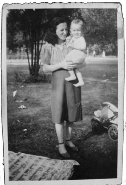
Sándor édesanyjával ugyanakkor