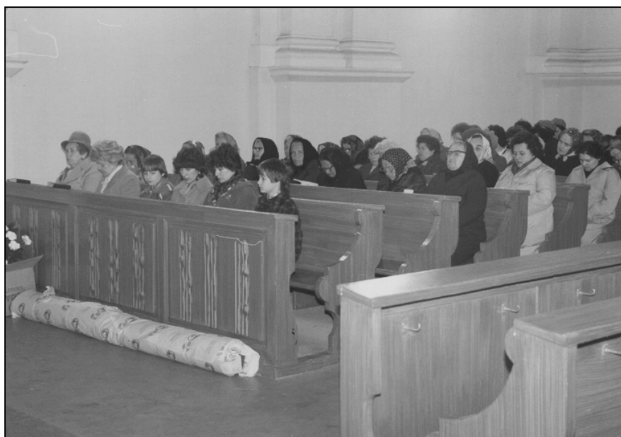
A gyülekezet a lelkési búcsúztatón (1984)