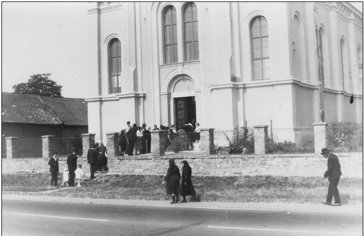
A templom szentelésére érkezik a gyülekezet