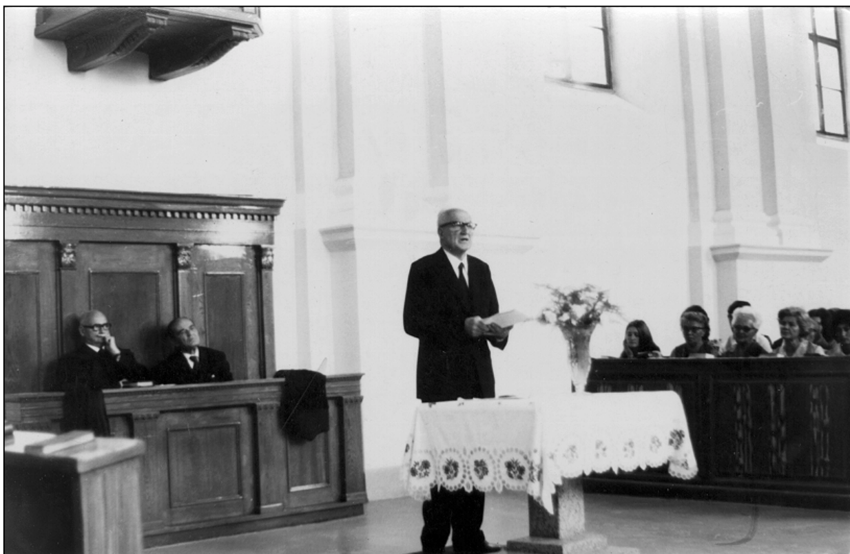
Felszentelési istentisztelet az új templomban (1973) Lelkeszi beszámoló