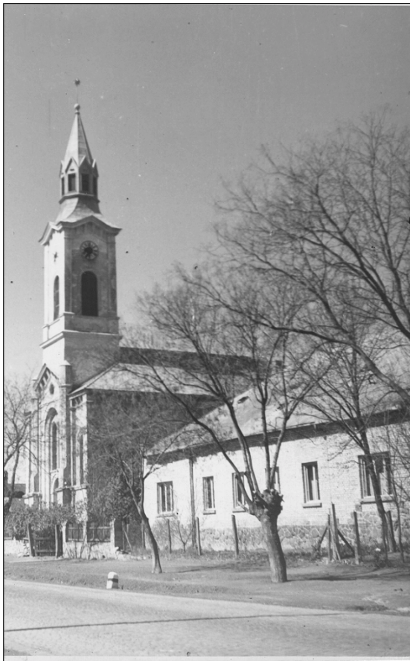
Az újjáépült templom és parókia