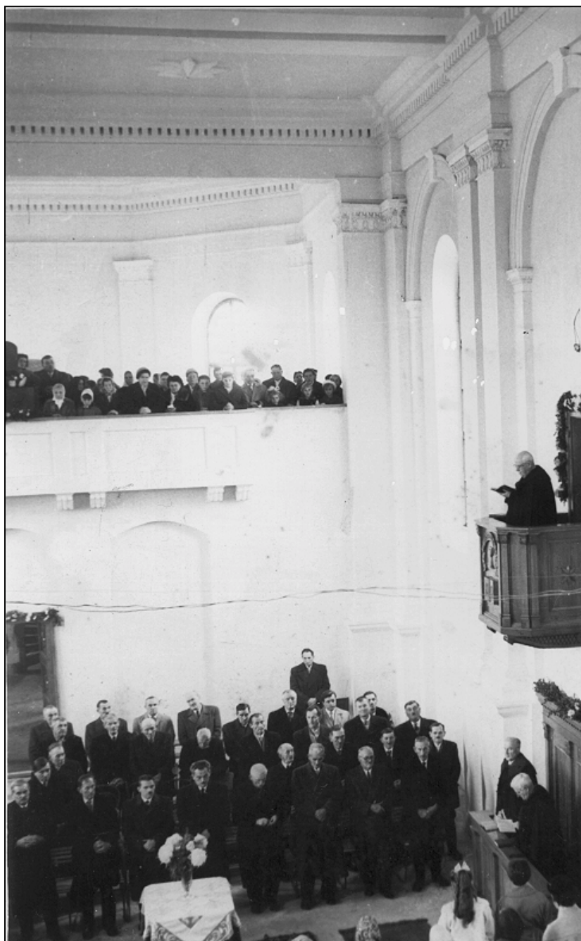
György Elemér püspök felszentelő beszédet mond a templom első részleges felszentelésekor (1961)