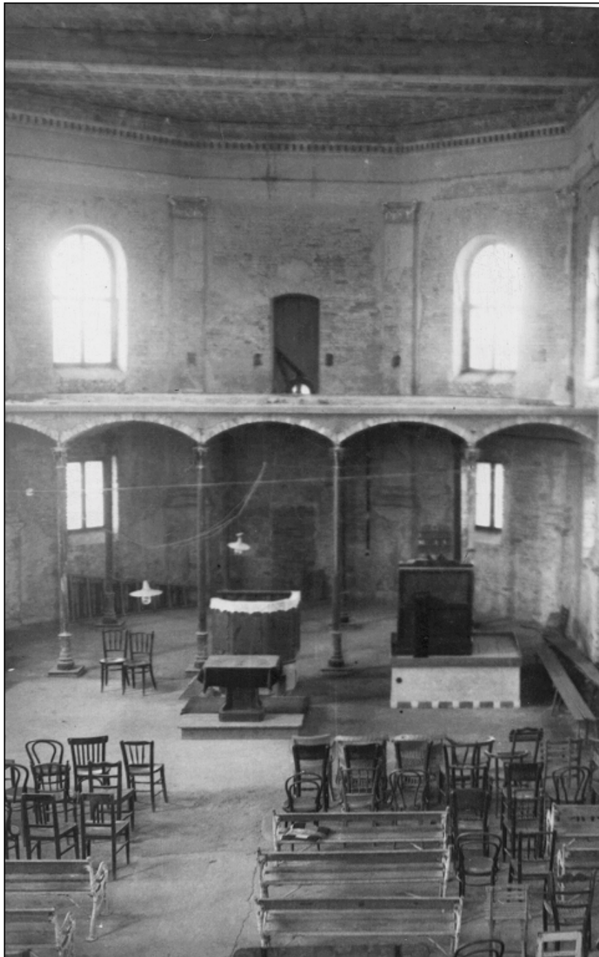
Az első felszentelési állapot (1961)