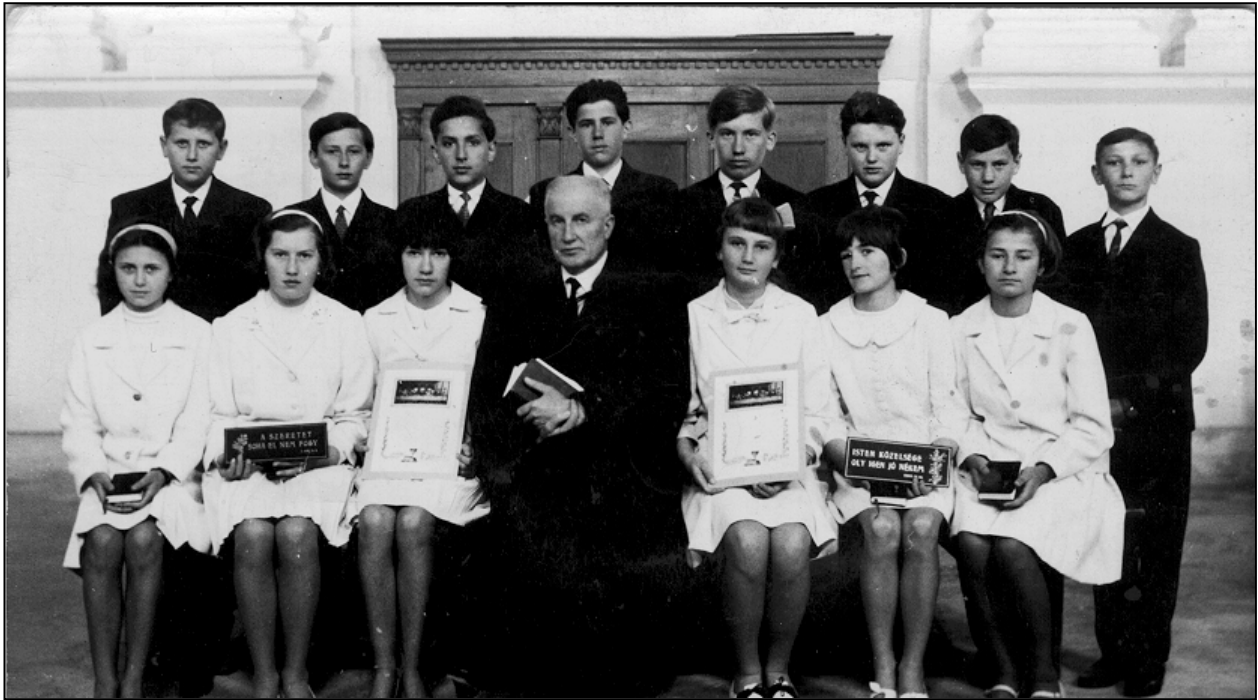
Konfirmáció (1966). A lelkész jobbján legkisebb leánya