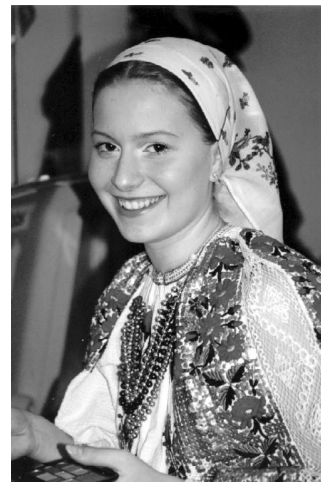
Horvát népviseletbe öltözött lány

A kisebbségi önkormányzatok olyan választott testületek, amelyek települési, illetve országos szinten képviselik az adott nemzeti vagy etnikai kisebbség érdekeit. Az egyesületi keretekben működő szervezetektől eltérően a helyi kisebbségi önkormányzatok nem csupán tagságukat, hanem a település egész kisebbségi közösségét képviselik. Országos szinten az országos kisebbségi önkormányzatok képviselik az adott kisebbséget: a törvényhozás és az államigazgatás partnereiként nyilvánítanak véleményt az