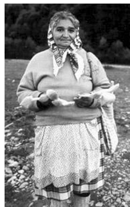
Román kisebbségi asszony