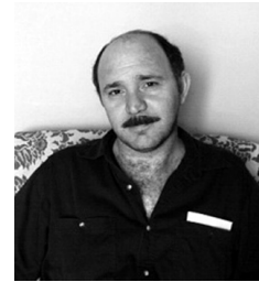
Örmény kisebbségi férfi

és kollektív 13 ) jogokkal kell, hogy rendelkezzenek, mint a többség tagjai, ugyanúgy joguk van részt venni az állam életének formálásában. Az alkotmány szavatolja jogukat a közéletben való kollektív részvételre, kultúrájuk ápolására, anyanyelvük széleskörű használatára, az anyanyelvi oktatásra és a saját nyelvű névhasználatra. A kisebbségekről szóló törvény rögzíti a kisebbségeket megillető egyéni és kollektív jogokat az önkormányzatiság, a nyelvhasználat, az oktatás, kultúra és közművelődés területén. A kollektív jogok között a törvény kimondja, hogy a kisebbségeknek jogukban áll helyi és országos önkormányzatokat létrehozniuk. A kisebbségek országgyűlési képvisellete viszont egyelőre megoldatlan kérdés.