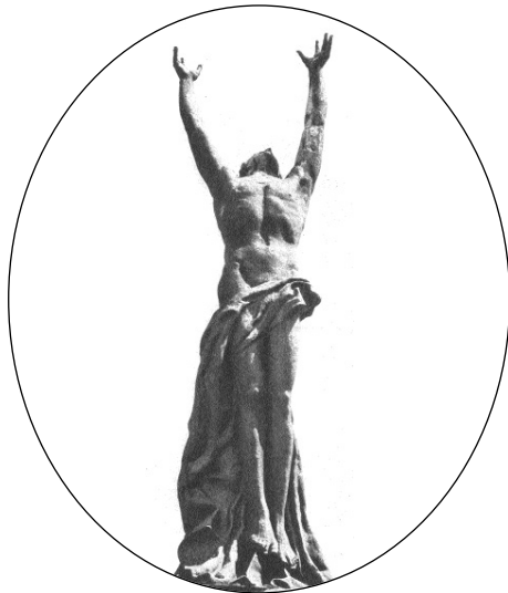
Rigele Alajos: A Madách-emlékmű részlete. Ádám szobra

„Erőnk az emlék, ápolván a multat, Jövőnk alapja a küzdő jelen.”