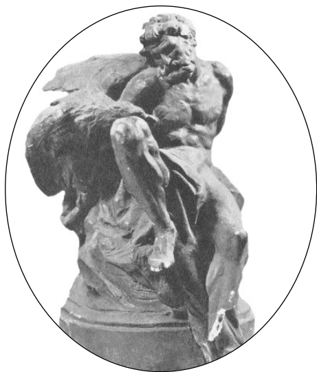
Rigele Alajos: Prométheusz

„Nekünk Mohács kell? – az hát, íme, itt van, Mi átkos sorsunk Mohácsnál mohácsabb; Verd melled, ki itt élsz holtodiglan, S kérdezd, bűnünkre van-e még bocsánat.”