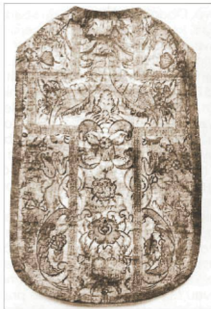
Börkazula színes nyomatú festett díszítéssel, 17.-18. század

századra tehetjük. Hasonló időből származik a többi kiállított evőeszköz is: hordozható filigrán kolekciók cseh-gránitkővel kombinálva, valamint két ezüst-kávéskanál gravírozott iniciálékkal (1671).