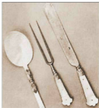
Gyöngyház díszítésű habán evőeszköz, 17.- 18. század

A középkori Pozsonyban az iparművészek közül legjobban az asztalosok, ékszerészek és fémöntők érvényesültek. Munkáik közül többet megtalálhatunk a pozsonyi templomok leltáraiban (Szent Márton dóm, Ferencesek temploma).