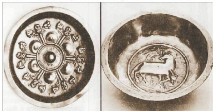
Sárgaréz gótikus keresztelőtál, 15-16. század

Az I. Csehszlovák Köztársaság idején a Múzeum többségében régiségkereskedőktől vásárolta az értékes tárgyakat (Jerábek cég, Kohn, Lock). Egyes anyagok csoportjaiból legnagyobb akvizíciókat a keramika, üveg és fémek képezték. Az 1930 – as években a kiállítás létrehozásában és a szakmai feldolgozásban nagy érdemeket szereztek az