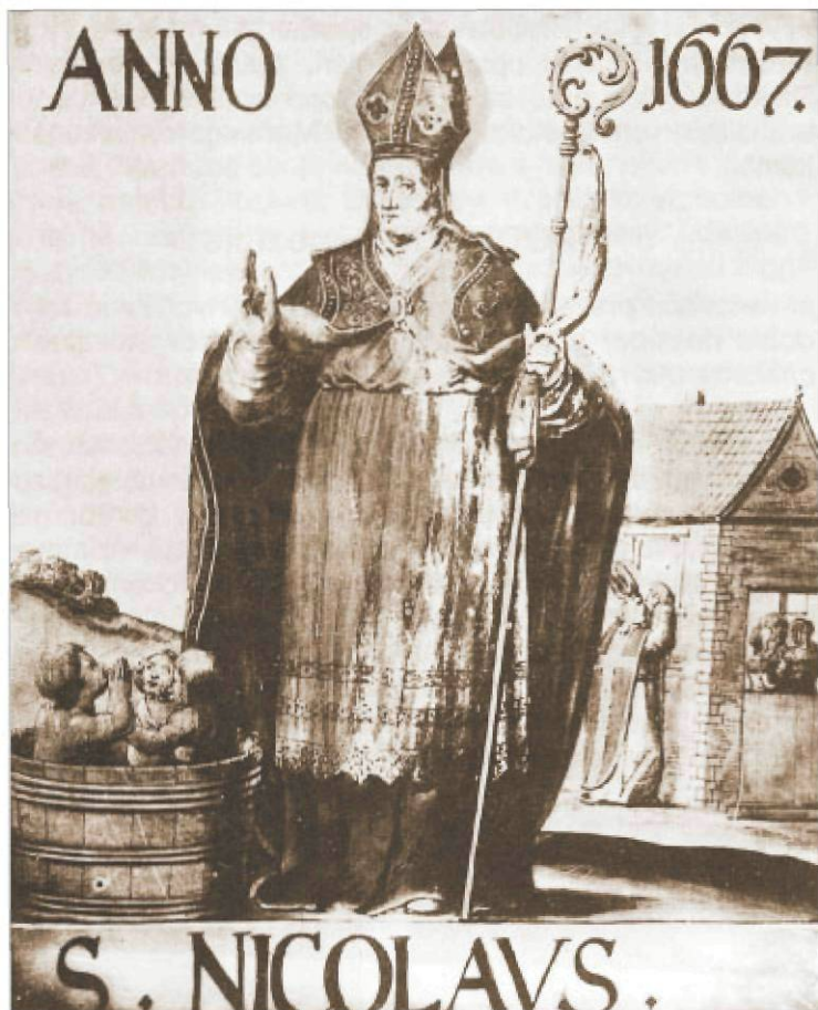
Üvegfestmény - Szent Miklós, 1667 (Szent Márton dóm)

ebbe a tömörületbe sorolták a nagyszámú távolabbi környék ónosmestereit is. A 17. században már több mint 40 mester neve van jegyezve. Munkatervükben különböző