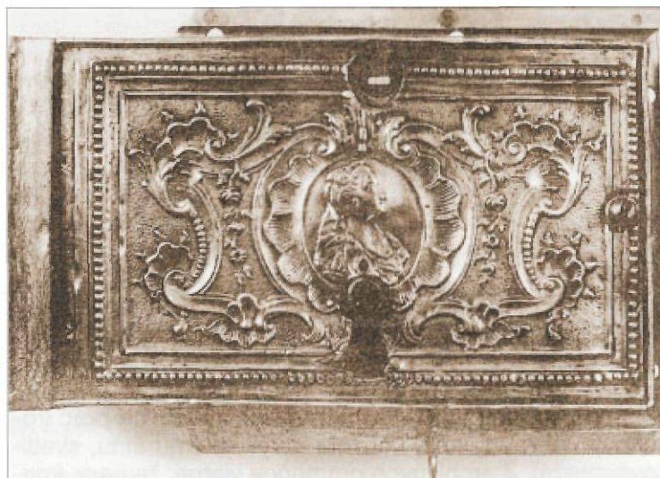
Ajtózárr Mária Terézia képmásával, cínezett vas, sárgaréz, 1765-1780