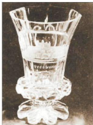
Metszett tisztán üvegből készült pohár Pozsony látképével, 19. század

veg volt masszív ballusztetes levélszárazakon, az empire és a biedermeier korában előtérbe kerülnek az egyszerűbb, többségében henger alakú és kúpszerű pohárformák. Többségében színes üveget használnak, leggyakrabban lazúrákkal, vagy rétegezett üveget, csiszolt díszítéssel. Különlegességnek számít a tejüveg festett díszítéssel, ezzel a porcelán imitációját keltve, vagy a tiszta üvegből készült poharak, kívülről gyöngyös hímzésmintával.