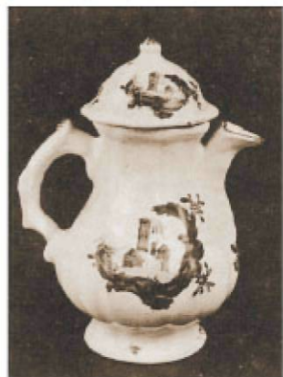
Fajansz kancsó, Holics jelzésű, 18. század 2. fele