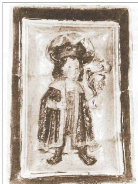
Glazúrozott csempé figurális motívummal, 15. század

(A jó pásztornál) elnevezésű házzal (1974-től a Történelmi Órák Múzeuma) elnevezésű házzal a pozsonyi rokokó polgári építészet legjellegzetesebb emlékét képviseli. Az épület a 18. század hatvanas éveiben készült, egy szabálytalan telken áll, diszpozícióival alkalmazkodva a közeli környezethez.