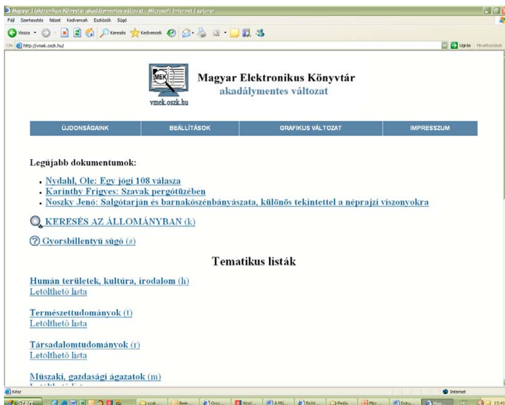
MEK akadálymentes változat

A MEK egyik legjellemzőbb tulajdonsága, hogy felhasználóbarát. A szolgáltatások kialakításánál külön hangsúlyt kapott a fogyatékkal élők ellátása. Az új grafikus MEK 2 rendszer bevezetésekor szükségessé vált egy, a vakok, gyengénlátók, és mozgáskorlátozottak számára kialakított felület létrehozása. 2003 novemberében készült el a MEK akadálymentes változata: a VMEK ( vmek.oszk.hu ). Ez a verzió jól használható lassú internet-kapcsolattal rendelkezők számára is.