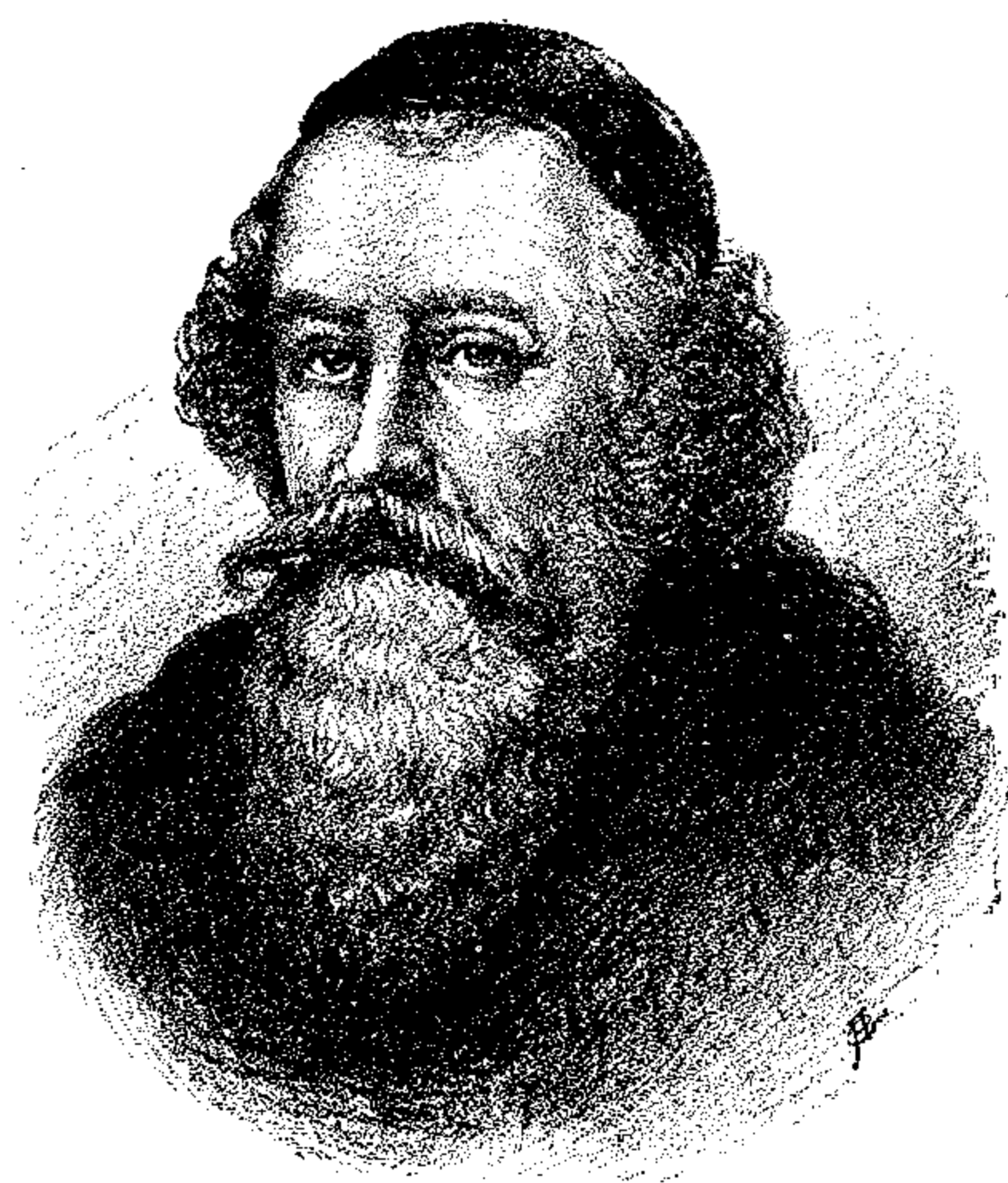
COMENIUS ÁMOS JÁNOS.

— SZÜL. 1592. MÁRCZ. 28-ÁN. MEGH. 1671. NOV. 15-ÉN. —