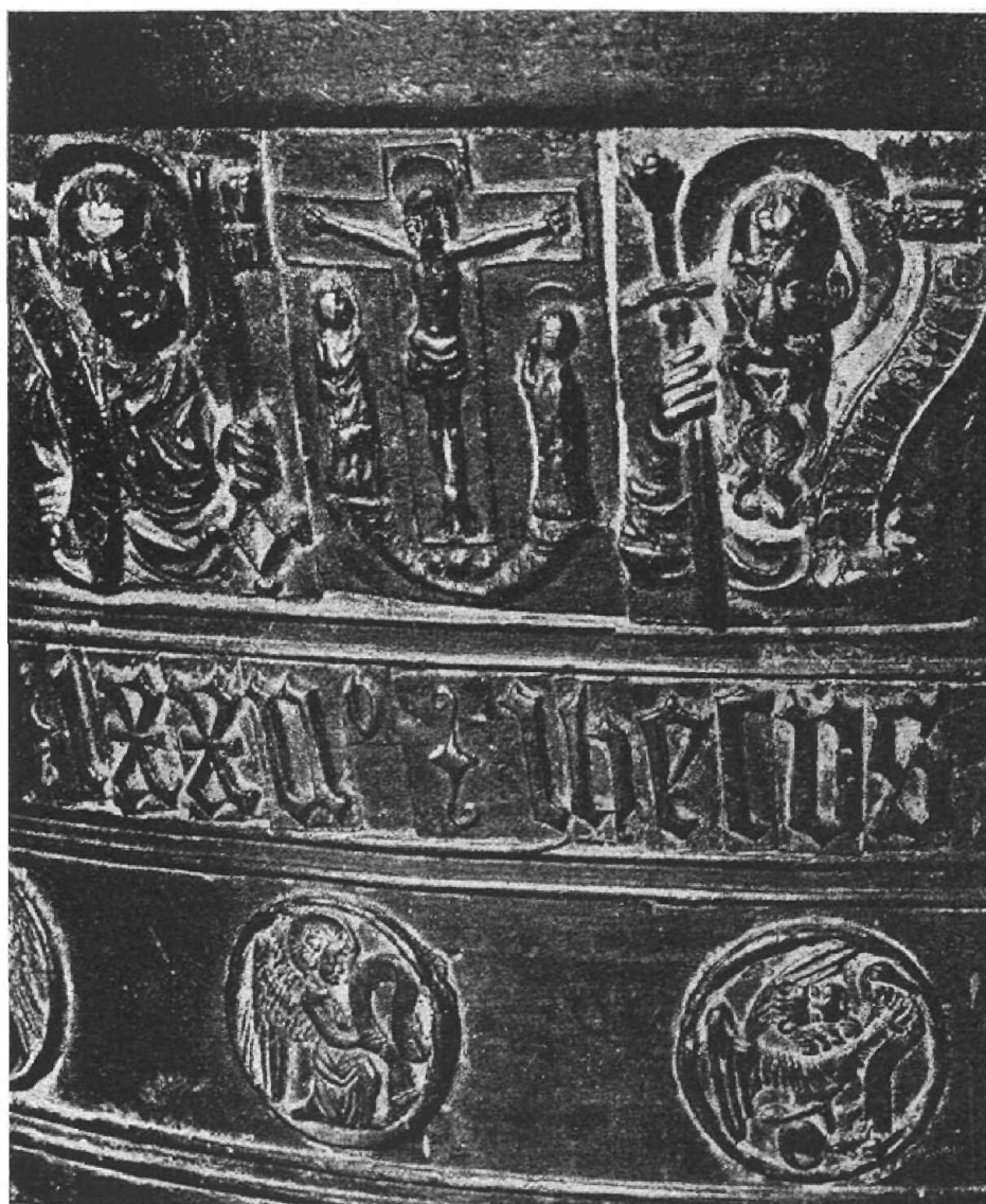
A késmárki keresztkút részlete.