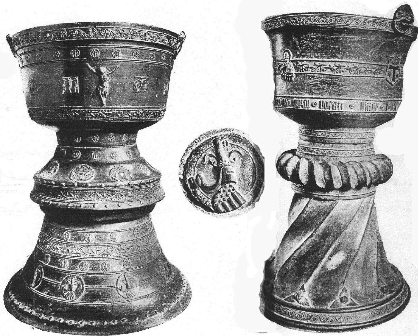
Nagy Lajos címere a svedléri keresztön.