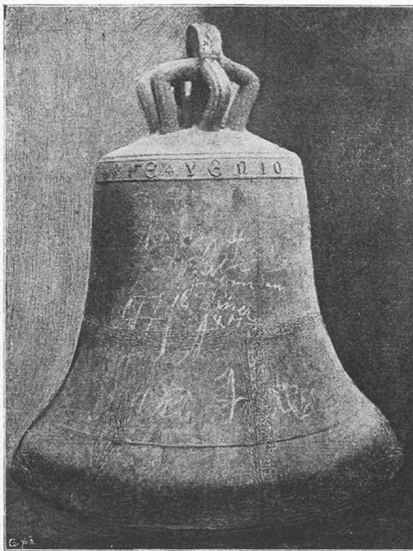
Márkusfalvi harang a XIV. századból. Jelenleg a kassai Múzeum tulajdona.