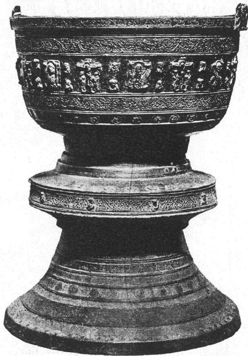
Keresztelő medence. Lőcse.