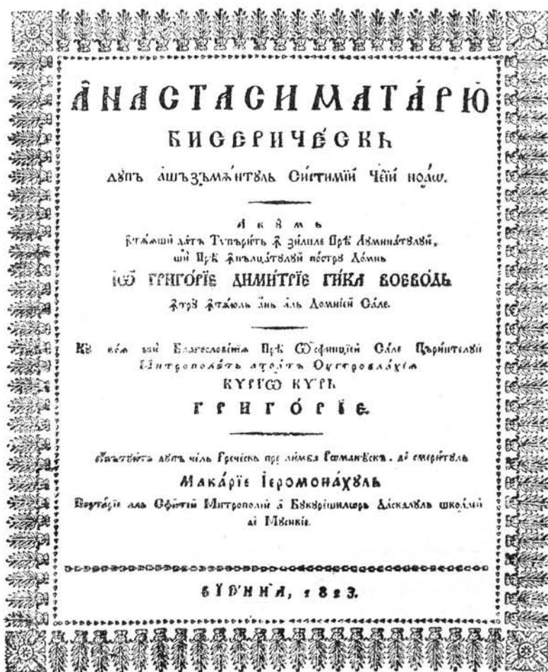
Macarie szerzetes templomi „Anastasiar”-jának címlapja. Bécs, 1823.

egyházi zenét. A mozgalmat betetőzi Cuza fejedelem 1863. február 15-i törvénye, amely az egyházi gyakorlatban megtiltotta az idegennyelvű éneklést. Ettől kezdve a templomokban románul énekelnek. Az egyházi énekek szövegét görögből Macarie és Pann fordította románra. Ugyancsak