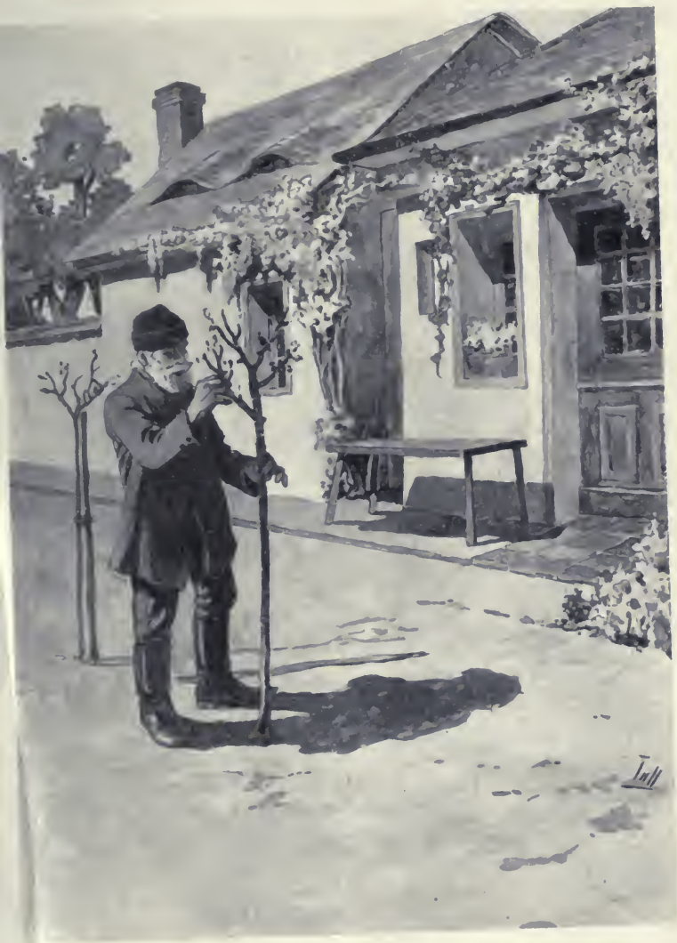
Gyümölcsfákat ültetett a házak és utak mellé.