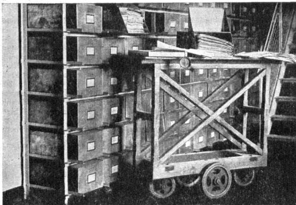
Az iratok elhelyezése és kezelése.

Levéltárunk a román egyetemi könyvtár árnyékában jelentősen ugyan nem gyarapodhatott, de falain belül a háború előtti rendezés szerve folyta-