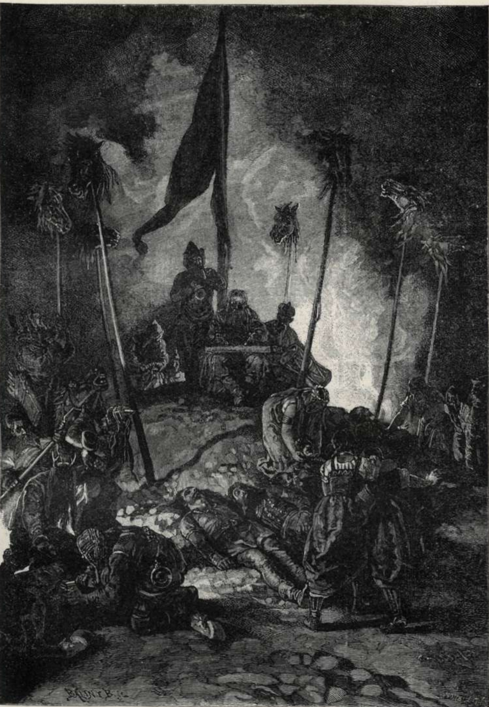
A halott vitézek sirhalomtáncza.