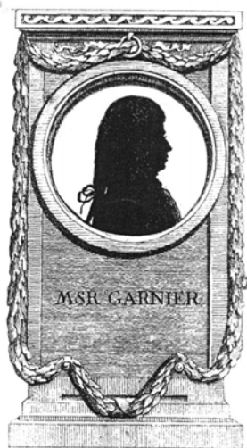
Franz Xaver Garnier sűgő