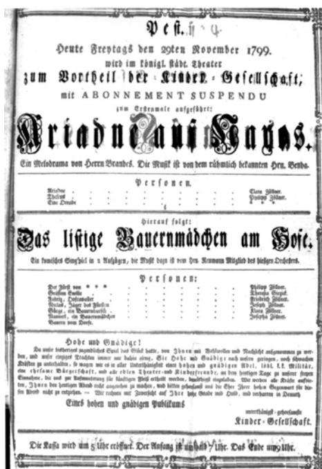
A Zöllnek-féle gyermektársulat 1799. november 29-i színlapja