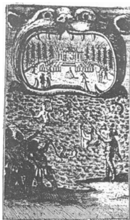
Hat színpadkép a berneri társulat 1782-es zsebkönyvéből