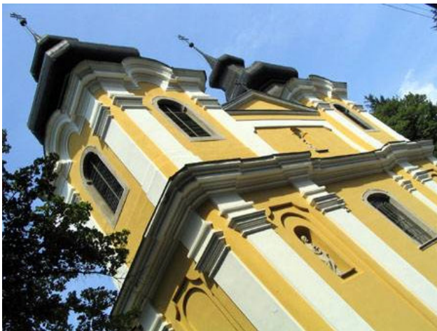
A Mátaverebély-szentkúti búcsújáró nagytemplom

A templomban misét hallgattunk, majd áldozás után kimentünk a nagy térre, ahol már javában folyt egy szentbeszéd. Nagyon elkésérített, hogy elkéstem, mert azt hittem, a hercegprímás szónokol, hiszen pont ezért jöttem ma ide, hogy őt meghallgassam. Valaki fölvilágosított arról, hogy ő csak tíz órákor, az ünnepség végén fog beszélni. Megnyugodtam.