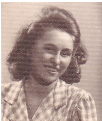
Szerző - korabeli kép

Utolsó nap a bányánál kellemes hangulatban telt el! Jól