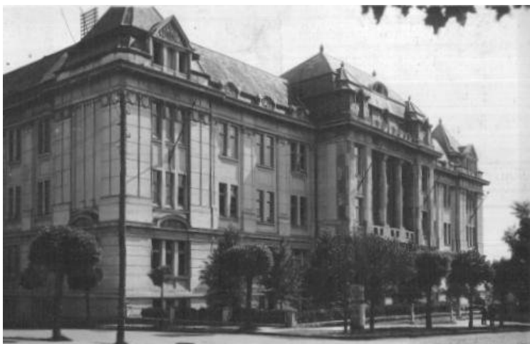
Marosvásárhely. Ebben az épületben tanultak az író gyermekei. (A földszinten Kereskedelmi középiskola, az emeleten tanítóképző működött.)