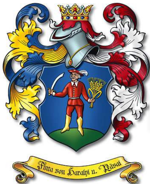
A Finta család ősi címere