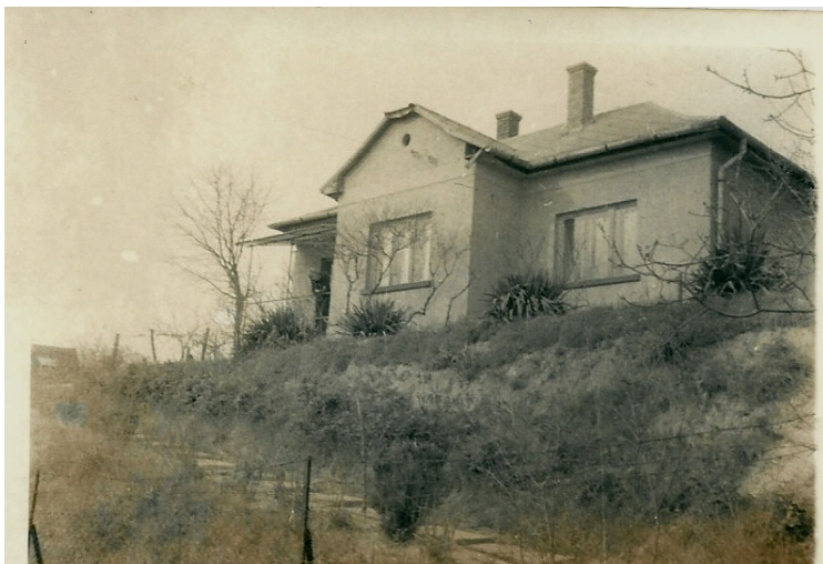
Szüleim Balatonkenese-üdülőtelepi otthona

Édesapánk életútját Finta Andrással (akkor még élő) testvéremmel együttműködve, 2008. évben állítottuk össze.