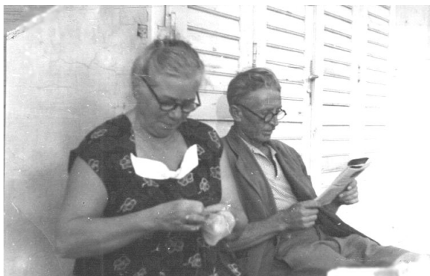
A megálmodott ház előtt

Nem zúgolódik, – ősi erény: – Küzdeni, túrni, várni tudunk; Míg az a szócska hirdeti ott, Él az örök hit: – Feltámadunk!