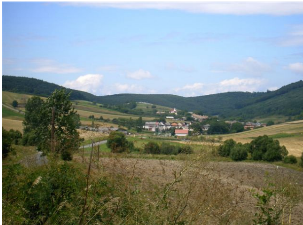
Kisbárcány a dombok aljában

Most, hogy teljes fénnel Arad a sugára, Eljött a megváltás A magyar hazára.