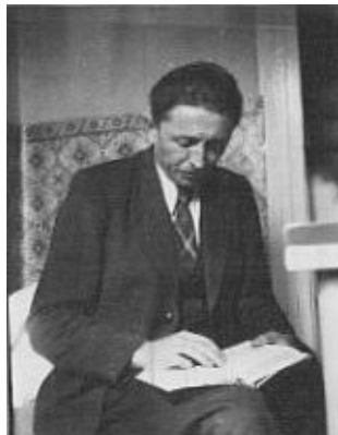
Finta István költő