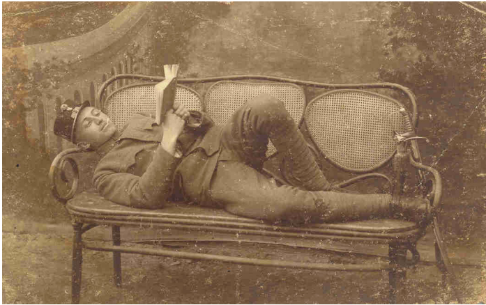
Első világháború idején