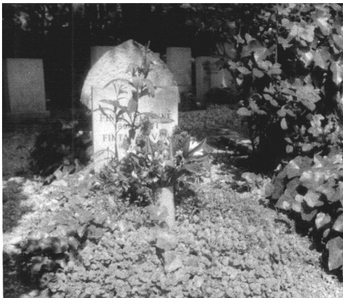
A költő és felesége nyughelye a Farkasréti temetőben