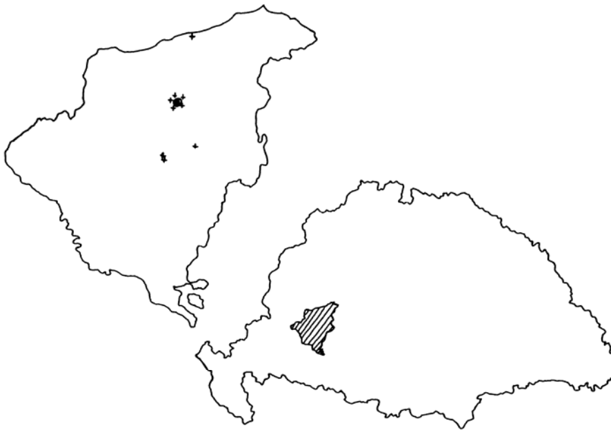
5. térkép A Borda család rokonai és birtokai

A Borda család egy másik típust képvisel. A család tagjai egy egész falut (Pamukot) mondhattak a magukénak, és rokon családjaik hálózata szemmel láthatóan e település, mint központ köré rendeződik.