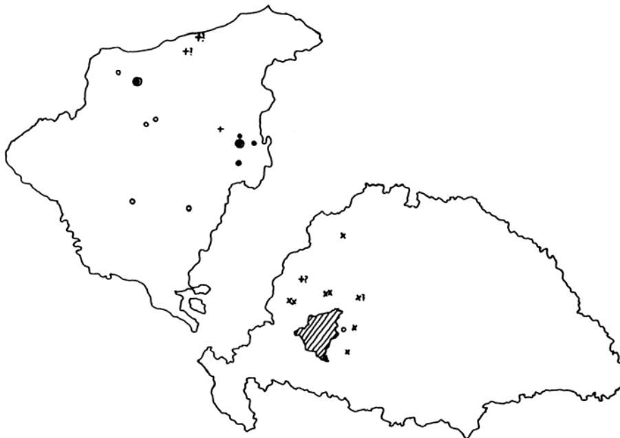
7. térkép A gyulai Gaál család rokonai és birtokai

A gyulai Gaál család már a legfelső szintet képviseli vizsgálatunkban. Fészkük Büssü volt, de 1807-ben a család egy tagja Boronkán élt, ahol a família szintén birtokos volt. A velük sógorságba kerülő családok többsége már nem somogyi volt