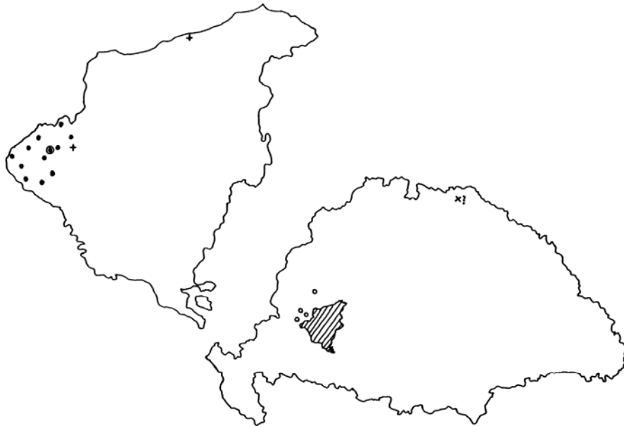
8. térkép Az Inkey család rokonai és birtokai

A különösen gazdag Inkey család birtokainak tömbje a megye délnyugati csücskében helyezkedett el, csatlakozva a kevésbé kiterjedt zalai birtokokhoz. Az Inkeyek Somogy megyében teljes falvakat tartottak a kezükben. A család fészke Iharosbényben volt. Ami rokonaikat illeti, alig találtam egyet-kettőt. Erre részben magyarázatot nyújt az a körülmény, hogy a család két ága közül a népesebbik a Zala vármegyében fekvő Pallinba költözött, és tagjai így kívül kerültek e vizsgálat keretein.