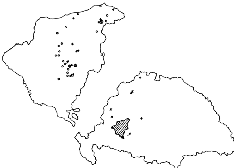
6. térkép A Mérey család rokonai és birtokai

A Méreyek a magyar köznemesség legrégibb családjai közé tartoztak. A família Árpád-kori gyökerei Somogy földjébe kapaszkodtak, de ágai a 18. századra már az ország területének nagy részét befönták. Korszakunkban a család három ága élt a vármegyében: Bárdon, Szerdahelyen és Tabon. Birtokaik a megye 25 falvának határában feküdtek. Házasság révén szerzett rokonaik jelentős része a megyén kívül élt – valamennyien az ország nyugati felében.