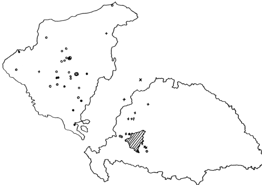
9. térkép A Somssich család rokonai és birtokai

A Somssich család a megye köznemességének talán legnevesebb, a 19. század folyamán országos hírnévre jutott, és két ágában is főnemesi rangra emelkedett családja. Birtokaik szét voltak szórva a megye szinte teljes területén. A család birtokközpontjai Somogyárdon és Kadarkúton voltak. A velük sógorságba kerülő családok többsége a vármegyén kívül, sőt kettő közülük az ország területén kívül élt: az egyik Bécsben, a másik pedig a cseh koronához tartozó valamelyik tartományban.