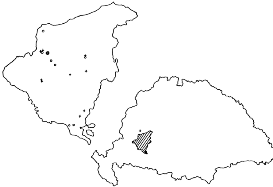
4. térkép A Bakó család rokonai és birtokai

A középső szintet képviselő családok közül elsőként a Nagyszakácsiban lakó Bakó família viszonyait vesszük szemügyre. A családnak a 17. században még hatalmas kiterjedésű birtokaiból a 18. századra csak töredékek maradtak. Mind ezek, mind a rokon családok elég egyenletesen oszlottak meg a vármegyében. Mindazonáltal a Bakó családnak sem volt egynél több házasság révén szerzett rokon családja Somogy megye határain túl.