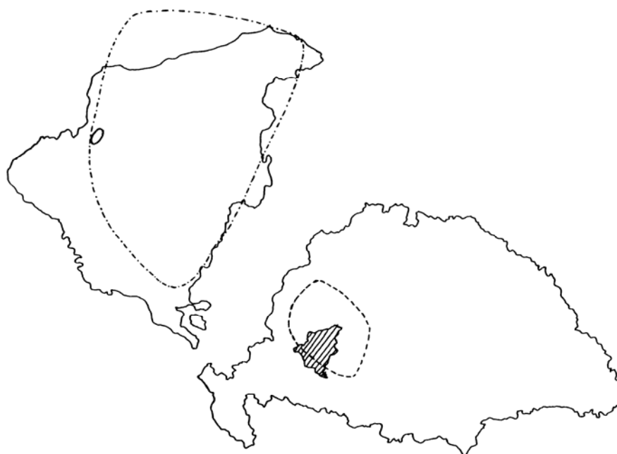
10. térkép A három vizsgált csoport rokonai kapcsolatai

Jelmagyarázat: ————— az 1. csoport rokonainak 80%-át keretező vonal - - - - - a 2. csoport rokonainak 80%-át keretező vonal - - - - - a 3. csoport rokonainak 80%-át keretező vonal