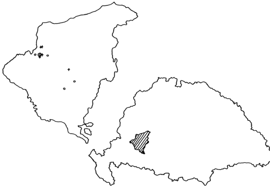
3. térkép A Kulcsár család rokonai és birtokai

A legalsó szinthez tartozó utolsó család, a Kulcsár család tagjai szintén Nemesviden éltek. Kisebb földjeik nekik már a nemesi községen kívül is voltak, a legtávolabbi lakóhelyüktől mintegy 5 mérföldnyire (körülbelül 42 kilométerre). A velük házasság révén rokonságba kerülő családok azonosítása során csak somogyiakkal találkoztam