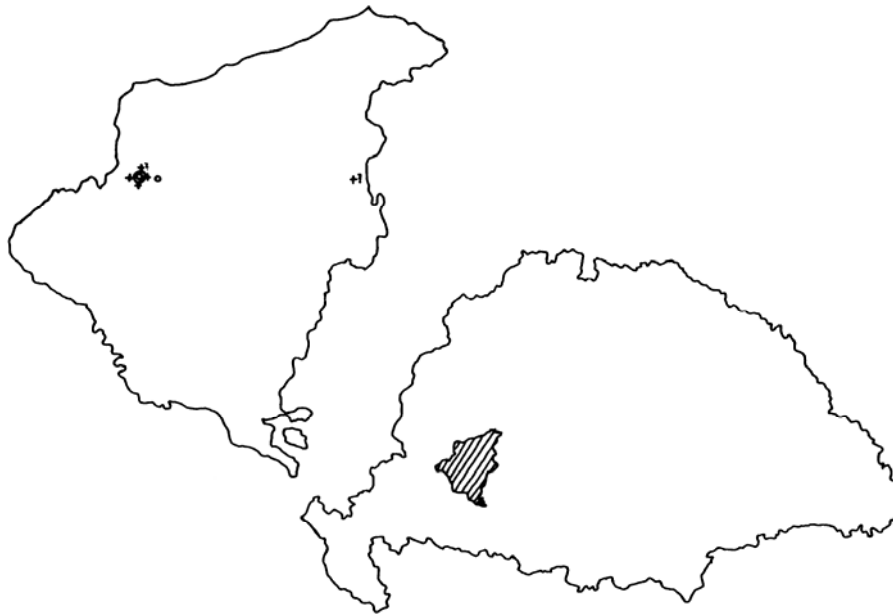
2. térkép A Kovács család rokonai és birtokai

A Kovács család szintén a curialista nemesek közé tartozott. Nemesviden éltek, csakúgy, mint házassággal szerzett rokonaik többsége. Földjük ebben a faluban volt és a szomszédos Nagyszakácsiban. Somogy vármegye határain túlról nősülő vagy oda férjhez menő Kováccsal nem találkoztam.