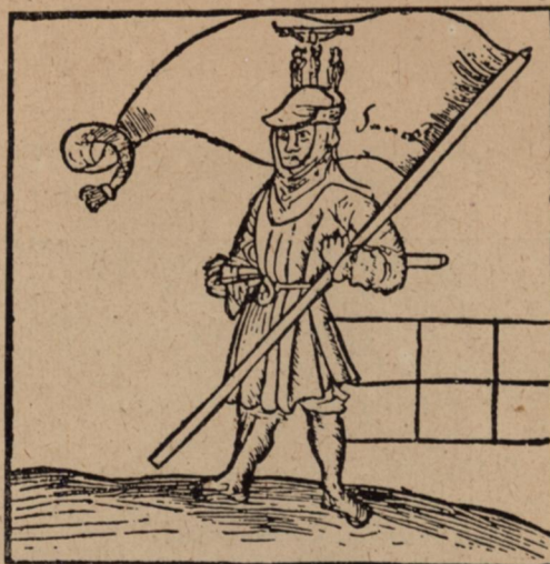
6. Magyar parasztkuruc 1514-ben. (Fametszet egykorú augsburgi újságlapon.)