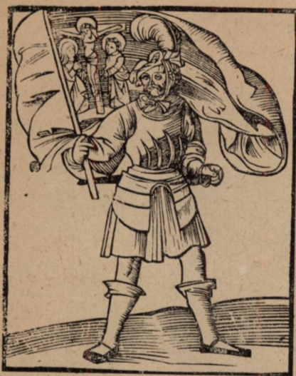
5. Magyar parasztkuruc 1514-ben. (Fametszet J. Vitalis Panormita egykorú tudósításán. Roma 1514.)