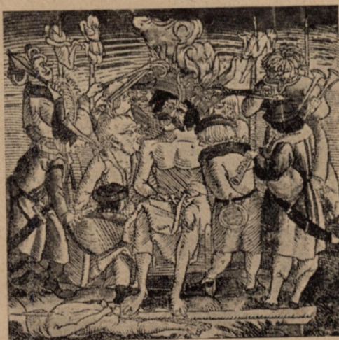
8. Dózsa György tűzes koronával. (Fametszet Taurinus hőskölteményének címlapján. Bécs 1519.)