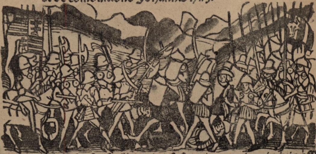
3. Huszita háború.

De bellis sigismūdi regis cōtra huzistas actis et de combustione Johannis hūz.