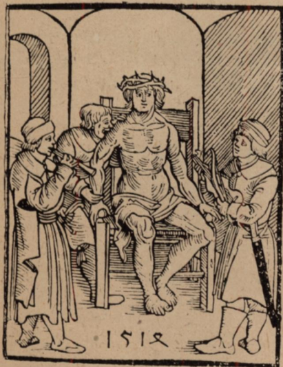
7. Dózsa György töviskoronával. (Fametszet egykorú német röpiraton.)