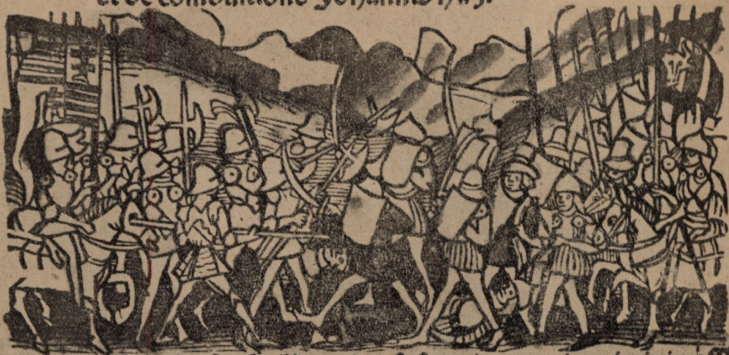
3. Huszita háború.

De bellis sigismūdi regis cōtra huzistas actis et de combustione Johannis hwy.