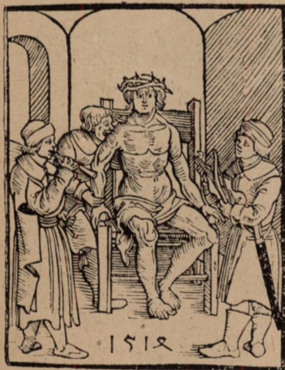
7. Dózsa György tűvisekoronával. (Fametszet egykorú német röpiraton.)