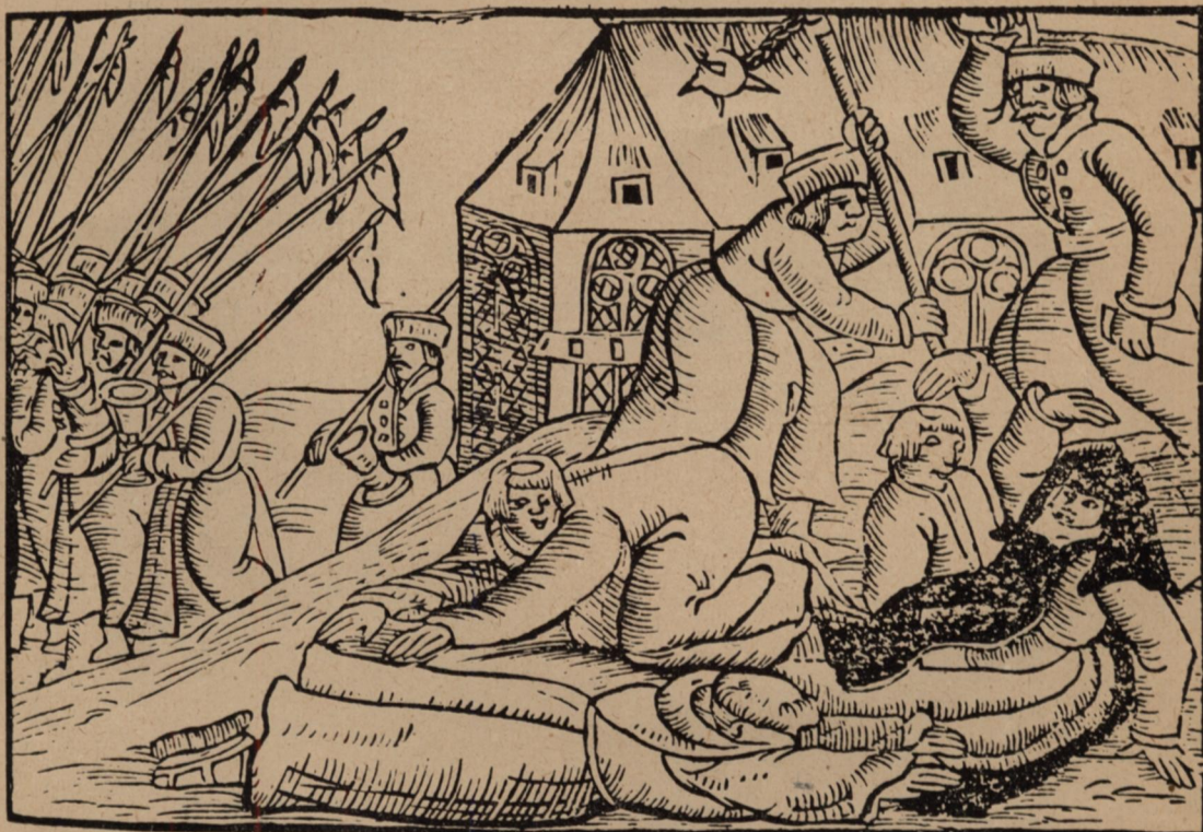
4. Husziták megtámadnak egy kolostort.

(Fametszet. Turóczi krónikájának augsburgi kiadásából. 1488.)