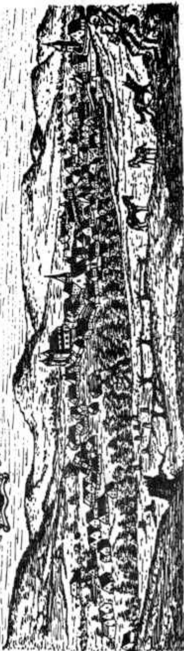
Székegyudvarhely a XVIII. sz. elején, J. I. Haas metszele (1734) nyomán