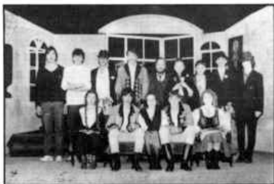
Vitéz lélek (színjátszó csoport)