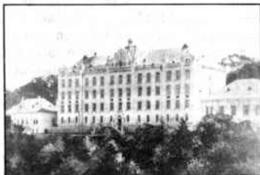
Az iskola mai épülete

„Szent ez a hely, mint Mózes csipkebokra, Szent, mint a frigynek áldott sátora! Sarud leoldva állj meg küszöbénél S szíved alázzad, ha belépsz oda! Mert templom ez! Oltárán őserények Istengyújtotta, büszke lángja ég S mely szertehordja majd e szép hazában: Ím, benne nő a tiszta nemzedék.”