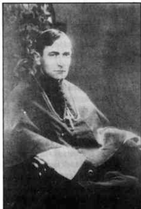
Márton Áron püspök

Érettségi vizsga: magyar, román, latin, idegen nyelv (német, francia, orosz választásra), földrajz (különös tekintettel Erdély földrajzára), történelem (különös tekintettel Erdély történetére), számtan, fizika, természetrajz, bölcsészet. Ugyancsak az MNSz kérésére a minisztérium elrendelte az ún. nemzeti tárgyak, a történelem és a földrajz magyar nyelven való tanítását a magyar tannyelvű iskolákban. Az MNSz, amelynek kolozsvári székhellyel közművelődési bizottsága működött arra kényszerült, hogy hetekig menő tárgyalásokat folytasson a magyar oktatásügyek méltányos rendezéséről. Ez mindenképpen gondolkodóba ejtette a tanárokat, szülőket, akik a Székelyudvarhelyen is megforduló Pătrăscanu 1945 nyarán Kolozsváron