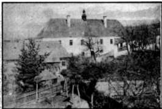
A r. kat. gimnázium első önálló épülete

Feltételezzük, hogy 1593-ban a jezsuita misszió a várban indította meg az iskolát és ott működött 1599-ig a vár lerombolásáig. A katolikusok 1633-ban kapták vissza a Szt. Miklós-hegyi plébániát és annak épületében hamarosan, ha szerény keretek között is, de újjászervezték az iskolát. Amint már előbb utaltunk rá a jezsuiták visszatérésével (1651) megindult az anyagi alapok összegyűjtése és az építkezés is. Azt is jeleztük, hogy 1655-ben az elszakadni akaró bethlenfalviakat is a schola építésére kötelezik az egyházi előjárók. Az építés valamikor az ezerhatszázhatvanas évek végén fejeződhetett be. Ez az épület azután két évszázadon át volt