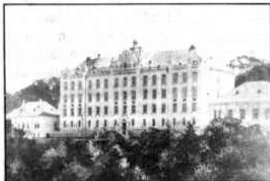
Az iskola mai épülete

„Szent ez a hely, mint Mózes csipkebokra, Szent, mint a frigynek áldott sátora! Sarud leoldva állj meg küszöbénél S szíved alázzad, ha belépsz oda! Mert templom ez! Oltárán őserények Istengyújtotta, büszke lángja ég S mely szertehordja majd e szép hazában: Ím, benne nő a tiszta nemzedék.”