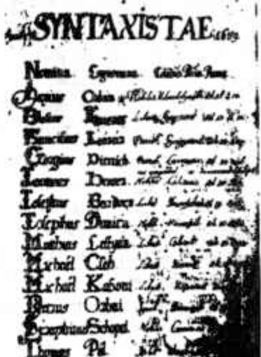
Az Album Gymnasii