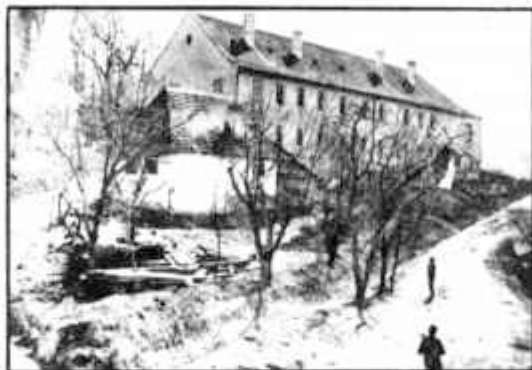
A fiúnevelde (convictus)

a különböző rangú ifjak elhelyezésére.” (34.) A tudósítás szerint a semináriumnak két épülete volt ekkor: az új, amiről már előbb szoltunk és a még lakott régi. Éppen az Album tudósításai segítenek abban, hogy pontosabb képet kapjunk a seminárium fejlődéséről. Az iskola első értesítőjében, amit az 1857-58-as tanévben adtak ki, azt olvassuk, hogy az 1705-ös évtől indult volna meg a seminárium. (35.) Az előbb idézett Album viszont félreérthetetlenül utal arra, hogy 1691-ben 16 növendéket tudott eltartani. Az újabb semináriumi épület létrehozási időpontját is helyesbítünk kell, az 1740-es évet fogadva el építési évként.