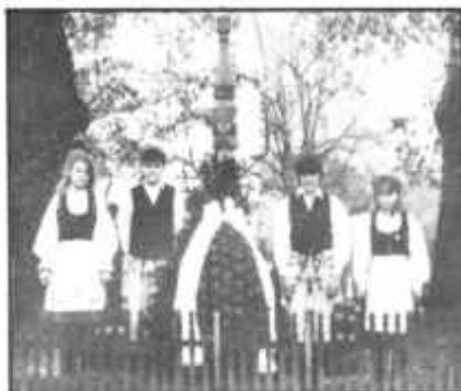
Tamási Áron sírjánál

Amikor a négyszáz évre visszatekintünk és lelki szemeink előtt elvonulnak a különböző korszakok diákjai, valahogy úgy vagyunk, mint amikor Tamási Áron egy nagy csokor tavaszi virággal kiment a temetőbe, hogy az édesapja sírjára tegye. Az apja és az ősök sírjánál kérdezi: „...,vajon feltehetem-e a kérdést: A mienk ez? Nem tehetem fel, mert ez kérdés nélkül a miénk. Miénk a fény, amit lelkünkbe fogadunk, s a föld, amelyen élünk és meghalunk”.