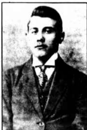
Tamási Áron diákkori fényképe

Sándor író, karikaturista a két világháború között és az azutáni időszakban a város művelődési életének meghatározó egyénisége; Nyíró József regény-, novella- és drámaíró, Mihály László költő, író, újságíró, ifj. Szemplér Ferenc (I-II. gimnáziumot járta itt) költő, regény- és drámaíró, műfordító; Színi Lajos újságíró, író, lapszerkesztő; Szántó Lajos költő, szerkesztő; Pap Jánosy Béla író, lapszerkesztő; Petelei István, a századforduló jelentős novellistája, az Erdélyi Irodalmi Társaság alapítója; György Dénes szavalóművész; Martian Negrea zeneszerző, zene-történész; Dobay László természettudományi szakíró; Ugron Gábor politikus, közíró; Balássy Ferenc történeti szakíró, a MTA levelező tagja.