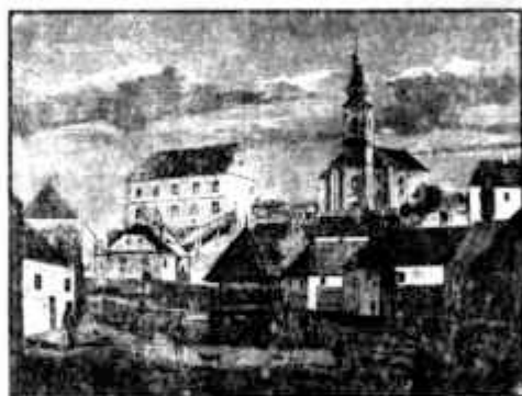
Templom és iskola

maga a katolikus gimnázium főépülete. Egy fényképfelvétel szerencsére megőrizte sok, sok nemzedék számára kedves, nyugalmat árasztó képét. Ott volt a plébániához felvezető fedett lépcső kezdeténél a domb aljában. Az 1980-as években az Iskola utca korszerűsítésekor feltárultak a vaskos falak alapozásainak részei és az építők a támfalban rögzítették is a gubacskövekből, mészhabarccsal rakott falmaradványt. Az épület emeletes volt, nyolc tantermet és a pedellusi lakást foglalta magába. Ha az elején meg is felelt a szükségleteknek, idővel természetesen szűknek bizonyult. Nem jutott hely benne sem a könyvtárnak (ezt a plébánia épületében helyezték el), sem tanári szobának. A természettani szertár részére az egyik osztályteremből deszkafallal kerítették el egy részt. A tanodát szervesen egészítette ki a fiúnevelde, ahol a nevelési tevékenység egyrésze lezajlott, valamint a plébánia és a jezsuiták ittartózkodásáig (1773) maga a zárda is. Az egész együttes azonos célt szolgált, így bár több épületben más-más tevékenységet végeztek, együtt volt mindez maga a schola. (48.)