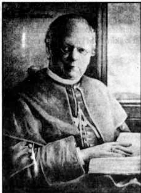
Majláth Gusztáv püspök

1918 őszén, tekintettel a rendkívüli körülményekre — amihez még spanyolnátha-járvány is társult — a tanítás későbbben kezdődött meg a szokásosnál. Dec. 5-én, négy évi vándorlás után a főépületbe is visszaköltözhatték a diákok. Visszatértek a katonai szolgálatra behívott tanárok is, és, bár még vannak helyettesítések, az alapvető tantárgyaknál zavartalanul folytatódik a tanítás. Az idei veni sancte azonban bensőségesebb lehetett, mint bármikor az eddigi években. Tanárok és diákok annyi megrázkódtatás után megerősödött hittel fejezték ki ragaszkodásukat a Mindenhatóhoz, egyházukhoz. Nem késett a főpásztor érkezése sem. 1919. márc. 28-29-én Majláth püspök meglátogatja az iskolát. Beszélt az ifjúsághoz, buzdítja a