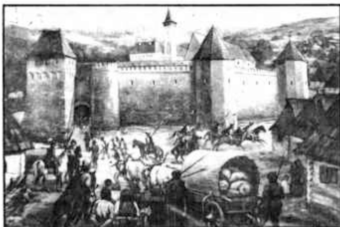
A székelyudvarhelyi vár