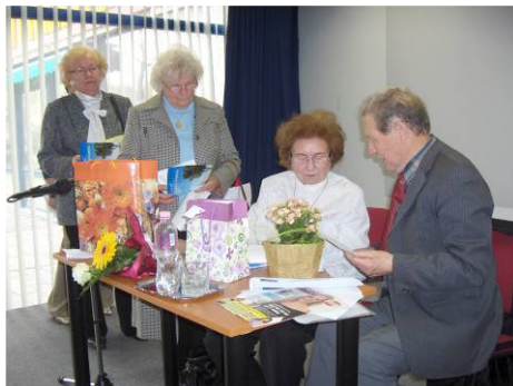
Könyvem dedikálása - és a salgótarjáni költővel

(Salgótarján, 2002. október) A hálás közönség tapssal jutalmazta.