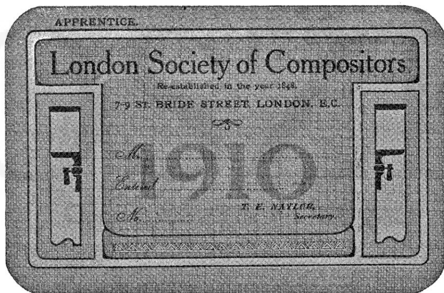
A londoni szedók egyletének 1910. évi tagsági jegye. 160 pályamunka közül az első díjat nyerte.

Tegyenek önök is úgy, mint a 95-iki bíró: mentsenek föl.