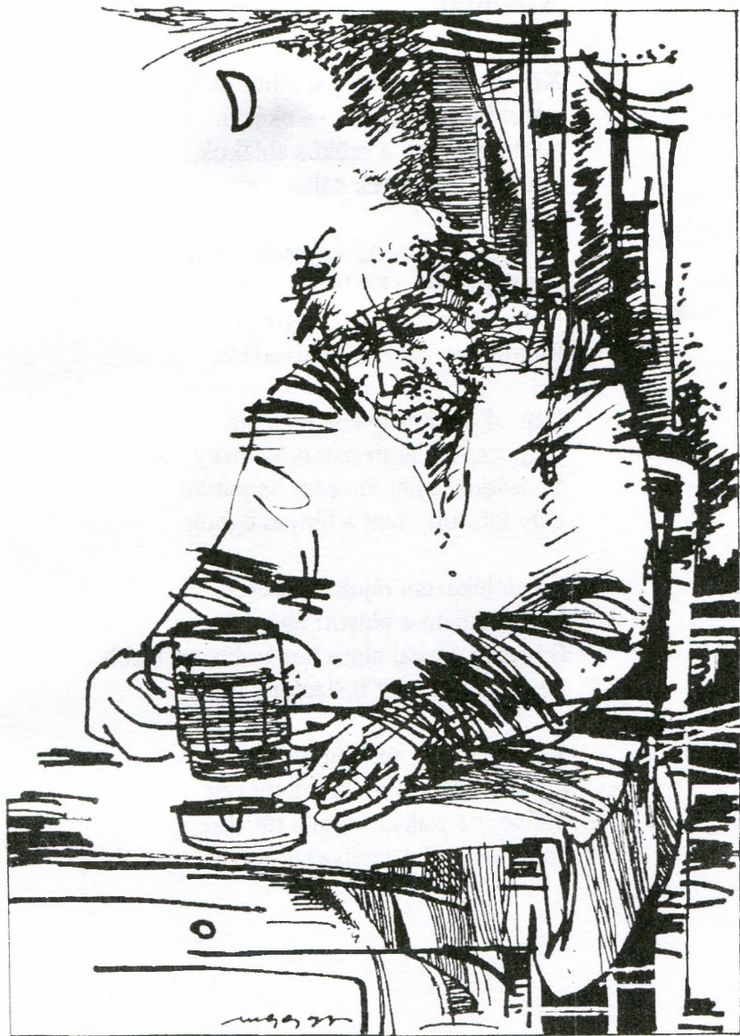
Bányász cimborám emlékére