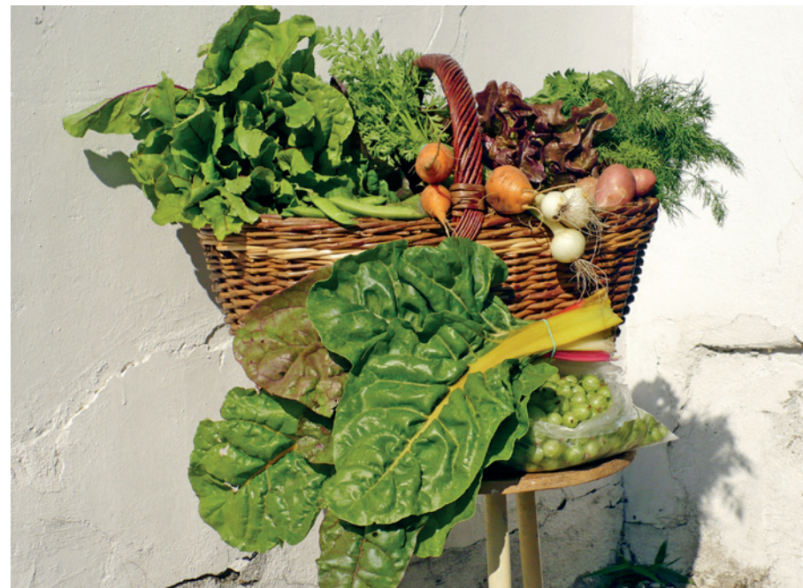
Kora nyári zöldségkompozíció

lehet a más termelőkkel való együttműködés. Ilyen módon rendszeresen vagy megrendelés alapján az érdeklő fogyasztók dobozába kerülhet gyümölcs, tojás, tejtermék, hús és egyéb helyi előállítású minőségi élelmiszer is. A kooperációval szélesíthető a tagok számára elérhető termékskála, miközben más helyi termelőknek is segítünk az értékesítésben, és jó szakmai-baráti kapcsolatok kialakítására, megerősítésére nyílik mód.