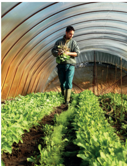
A szállítási szezon meghosszabbítható a termelési infrastruktúra fejlesztésével: zöldségajtatás fóliasátorban.

Adminisztráció: Fontos a kezdeti időszakban a pontos termésadminisztráció, vagyis a különböző termények betakarított mennyiségeinek terület alapú nyilvántartása. Ezzel elősegíthető a következő szezonban a pontos tervezés, az esetleges változtatások könnyebb megvalósítása.