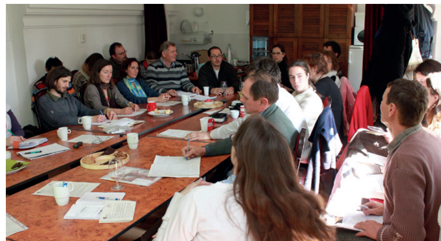
Műhelymunka az ÖMKi szervezésében: tapasztalatcsere a közösség által támogatott mezőgazdaság iránt érdeklődő és gyakorló gazdák között

A közösségi mezőgazdasági modell megismerése: Az ÖMKi és a Tudatos Vásárlók Egyesülete is szervez ismertető napokat, műhelymunkákat a közösségi mezőgazdaság témájában. Indulás előtt érdemes ilyen, vagy hasonló rendezvényen részt venni, hogy magyar és nemzetközi tapasztalatok alapján személyes betekintést nyerhessen a termelő a rendszer működésébe. Az ilyen programok jó lehetőséget nyújtanak a személyes kapcsolatépítésre és az esetleges kérdések megválaszolására is.