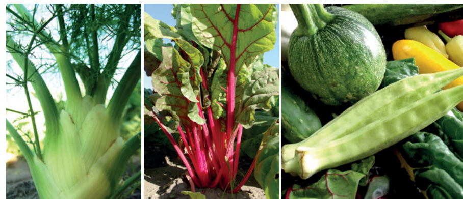
A széles terményskálába a hazai fogyasztók által eddig kevésbé ismert zöldségek is bevonhatók (balról jobbra: édeskömény, mángold, okra)

Kertészeti ismeretek: A közösségi alapú értékesítés a szezon alatt folyamatosan betakarítható termékeket, ennek következtében összetett, sok fajtából és fajtából álló termelést igényel. Ehhez elengedhetetlenek a magas fokú elméleti és gyakorlati zöldsgtermesztési ismeretek. A vetésszerkezet tervezéséhez fontosak az ökológiai (vegyszermentes) termesztés növénytársítással és vetésforgóval kapcsolatos ismeretei, a folyamatos ellátás érdekében pedig az egyes fajok és fajták tenyésztő-hosszával kapcsolatos ismeretek. Az ezekkel nem rendelkező termelők számára megfontolandó a fokozatos átállás, azaz először csak kisszámú tag bevonása a rendszerbe. Ahogy egyre inkább rutinszerűen működik a termelés, úgy lehet célszerű a taglétszámot évről évre növelni. A hazánkban jelenleg működő legnagyobb zöldségközösség 2013-ban hetente kb. 60 családot lát el zöldségekkel.