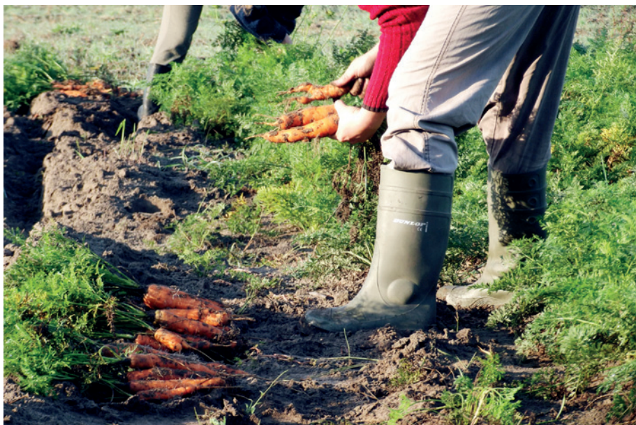
A munkateher kalkulációnál vegyük figyelembe a kisléptékű termelés magas élőmunka igényét

Munkateher kalkuláció: Amennyiben külső munkaerő bevonása indokolt, úgy fontos ismerni a helyi munkaerőpiac helyzetét. A termelési feladatok mellett figyelembe veendő a logisztikához, dobozoláshoz, szállításhoz szükséges munkaerő igény is.