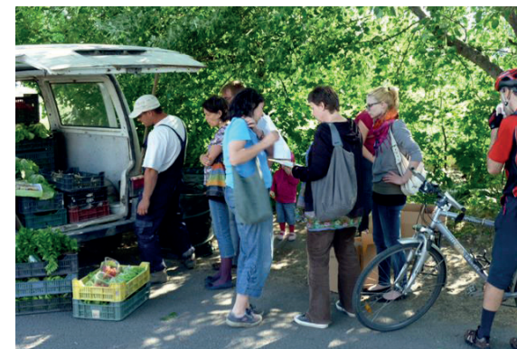
Az átvevőpontok közelsége révén akár kerékpárral is hazaszállíthatók a zöldségek, csökkentve ezzel az élelmiszerrendszer környezeti terhelését

Logisztikai sajátosságok: A piacon történő értékesítéshez képest zöldségdoboz rendszer működtetése esetén jellemzően kisebb az útiköltség és a csomagolóanyag-szükséglet, mivel hetente csak egyszer, általában a gazdasághoz közeli átvevő pontokra történik a szállítás. A pakolással és átvétellel együtt a szállítás általában egy teljes napot vesz igénybe. A logisztikai teendők rutinná válásához időre van szükség, óriási jelentőségű lehet a közösségi koordinátorral való együttműködés, azaz ha a közösség tagjai közül van, aki önkéntes vagy közel önkéntes alapon segítséget nyújt az átvételkor.