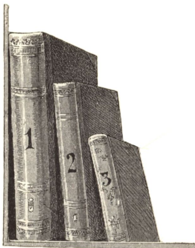
1. Ivrét. 2. Negyedrét. 3. Nyolczadrét.

magyar-német nyelven magyarázta Wenzel Gusztáv“ című mű haránt ivrét. Tájékoztatásul a könyvalak felismerésére szolgáljon a következő ábra: