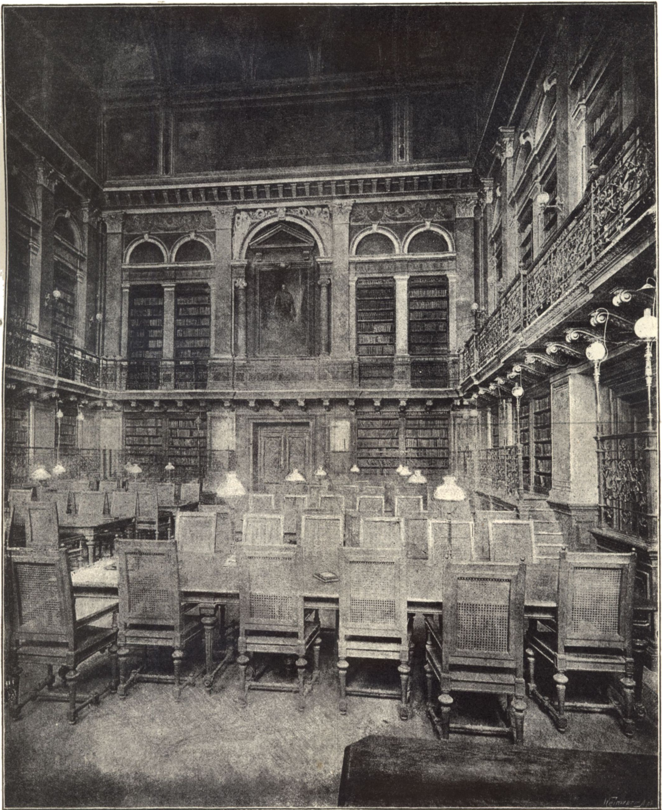
Az egyetemi könyvtár nagy olvasó-terme.