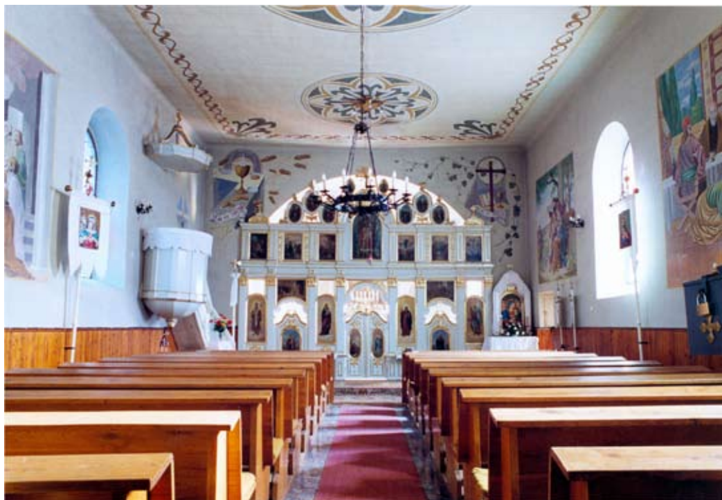
Templombelső 1975-ben és 2013-ban. Jobbra: a templom 2013-ban.