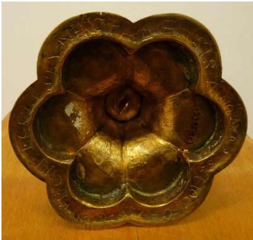
A 19. és 20. oldalakon: Aranyozott ezüst kehely 1668-ból.

Felirata: HOC OPUS FIERI FECIT ECCLESIA NECPALIENSIS ANNO 1668.