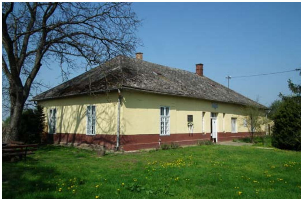
A görögkatolikus paróchia 1890-ben épült vályogból. Ma a község Falumúzeumának ad otthont.