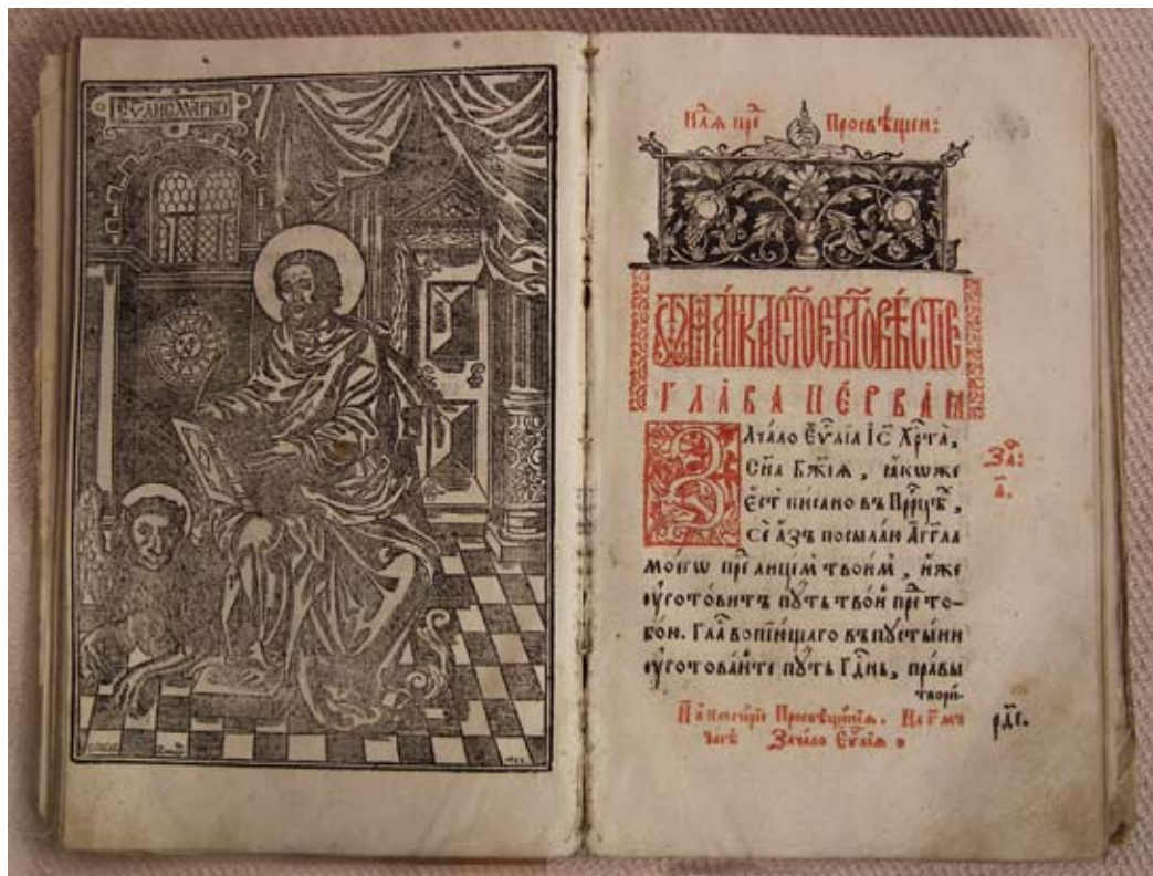
Egyházi ószláv nyelvű evangéliumos könyv Napkorról, melyet a moszkvai Pecsatnij dvorban nyomtattak 1683 után. IV. Iván Vasziljevics, más néven Rettegett Iván (1530–1584, 1533-tól moszkvai nagyfejedelem, 1547-től az első orosz cár) a Kreml szomszédságában felállíttatta a Pecsatnij dvor elnevezésű nyomdát, és irányításával Ivan Fjodorov diakónust, az orosz könyvnyomtatás atyját bízta meg. E nyomdában készítették Napkor görögkatolikus egyházának evangéliumos könyvét.

mintázat van vésve, közepén a STELLA szó olvasható.” 1