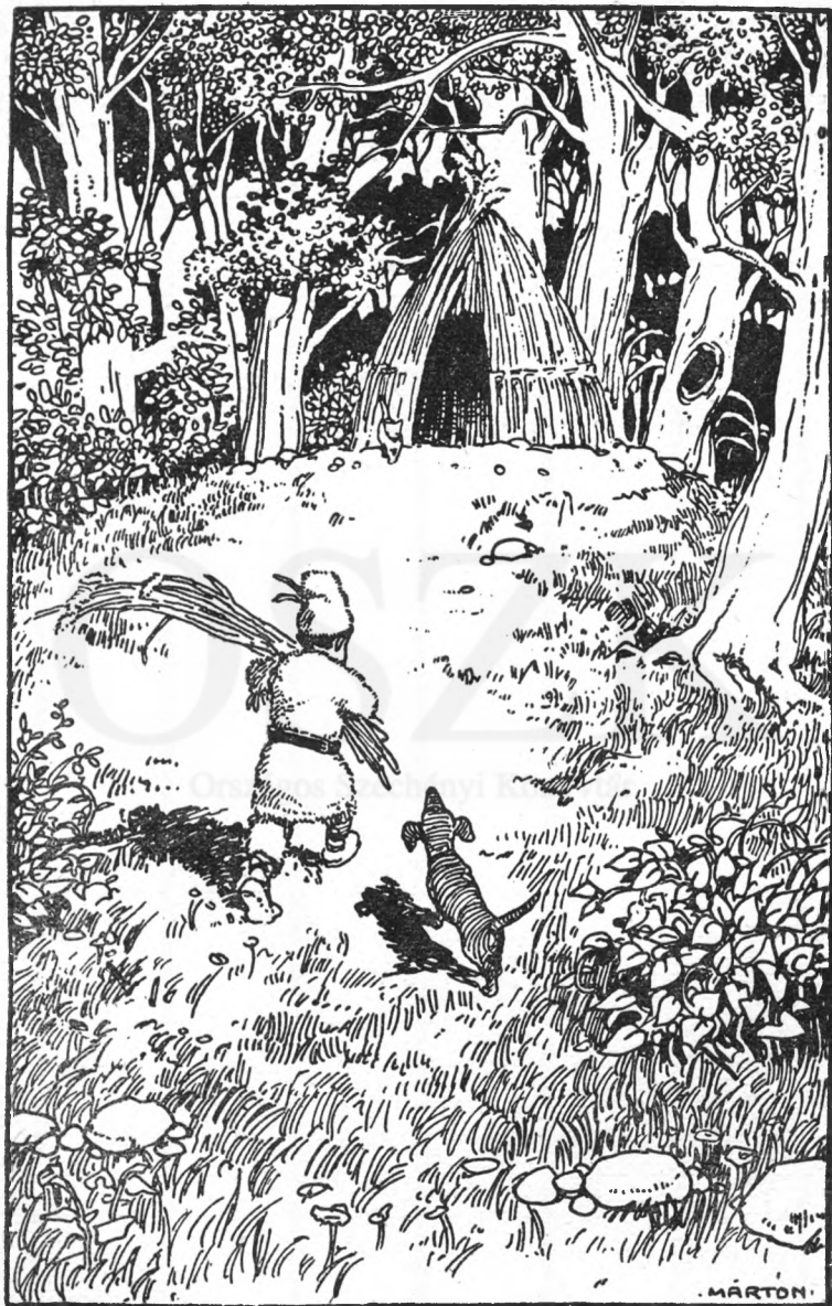
A száraz nádkévéket a Pióca-fok mellékéről kellett felcipelnie.