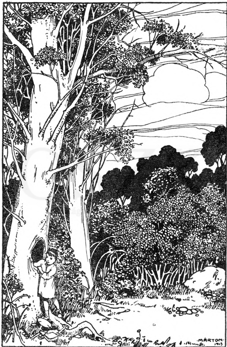
A vénhedt fa odvából kihúzogatta a szerszámaikat.