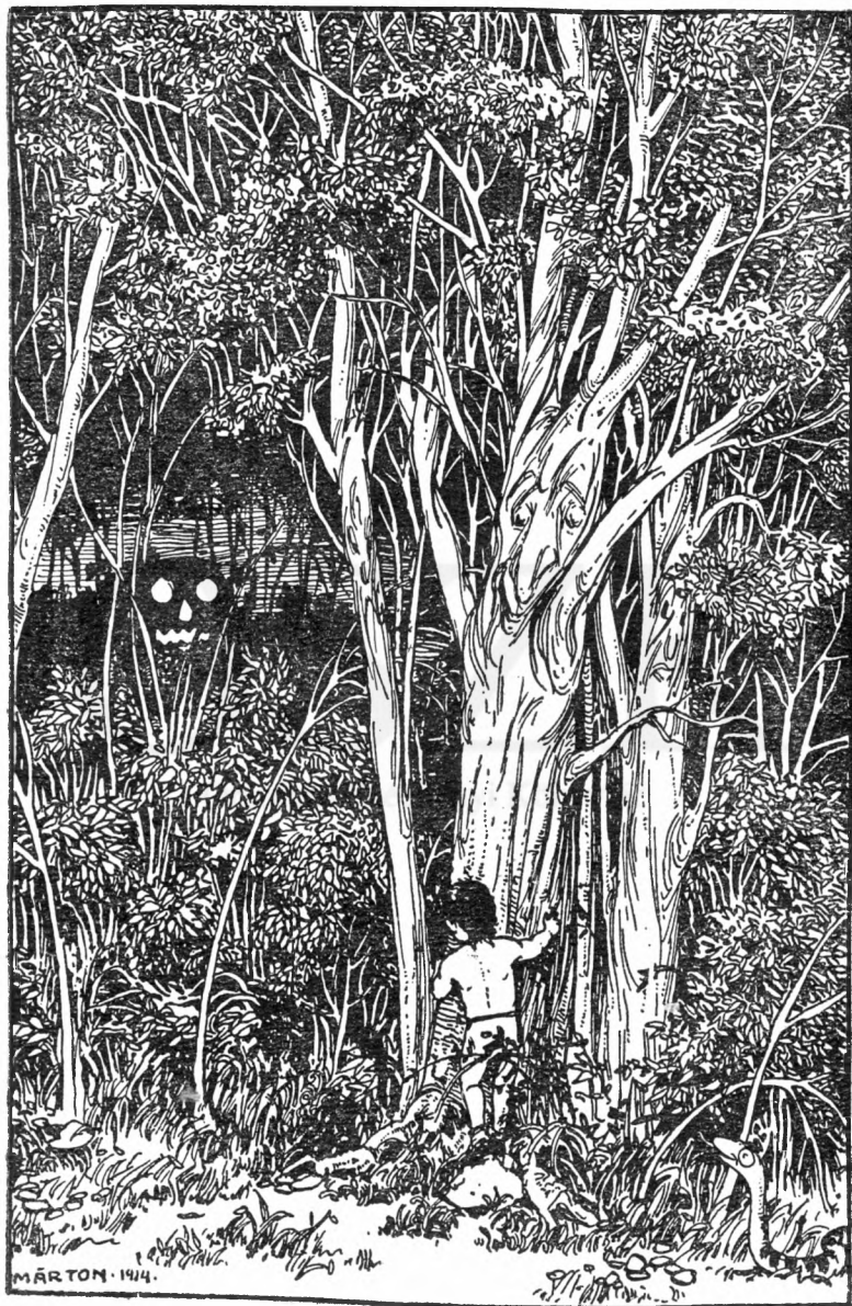
A kísérteties tüneménynek lángban égett a szeme.