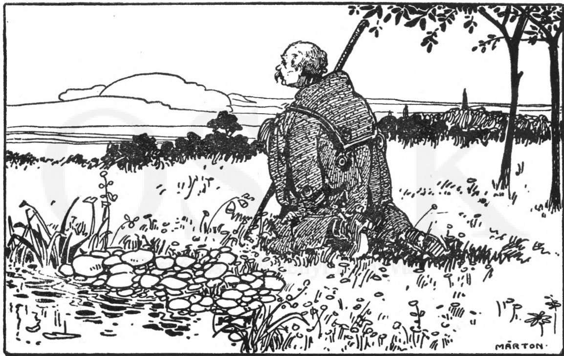
Mintha annak a rombadölt templomnak harangját hallaná...