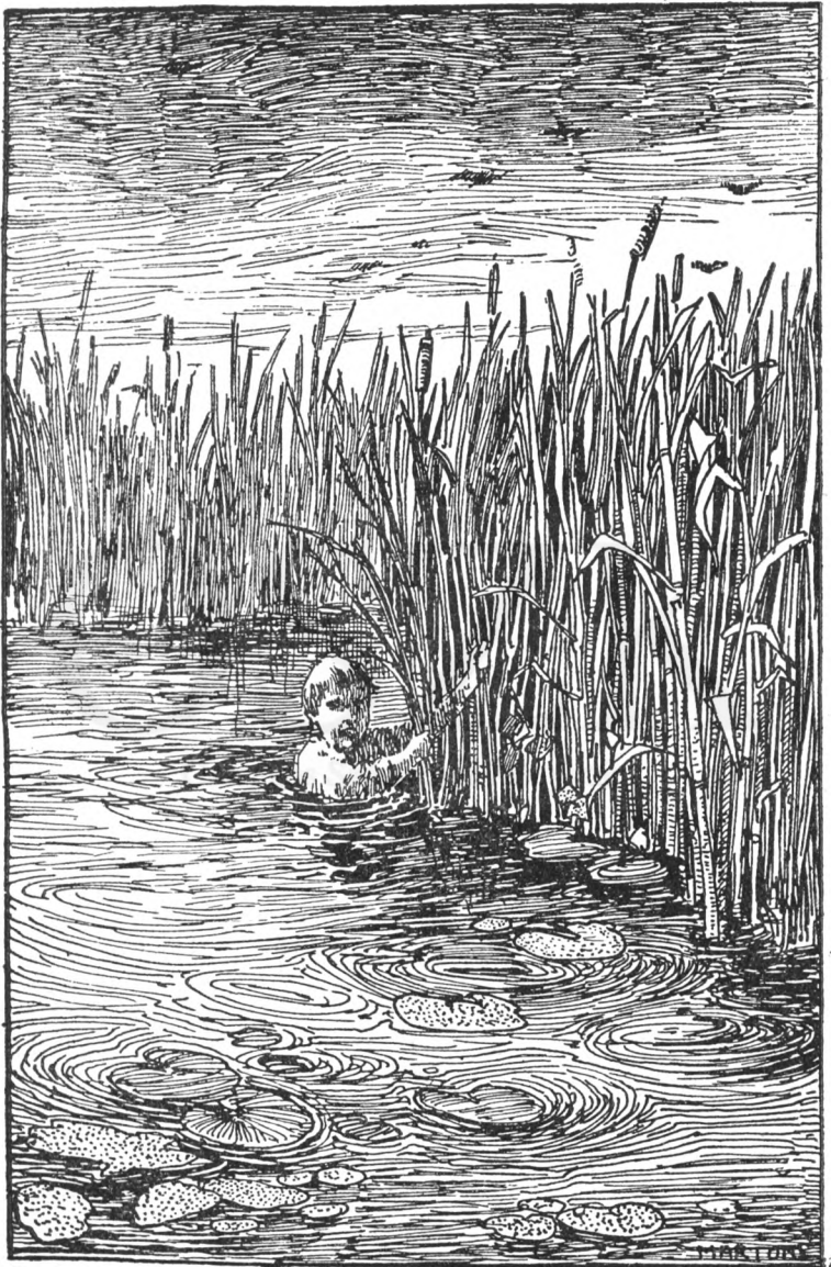
A nádszálakba fogódzkodva megkerülte a sziget csücskét.