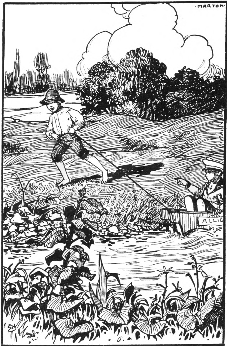
A gályarabnak kellett húzni a hatalmas hajót.