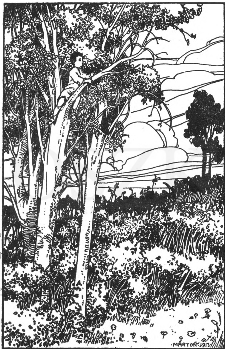
Sóvár szemekkel kémelte az akácost.