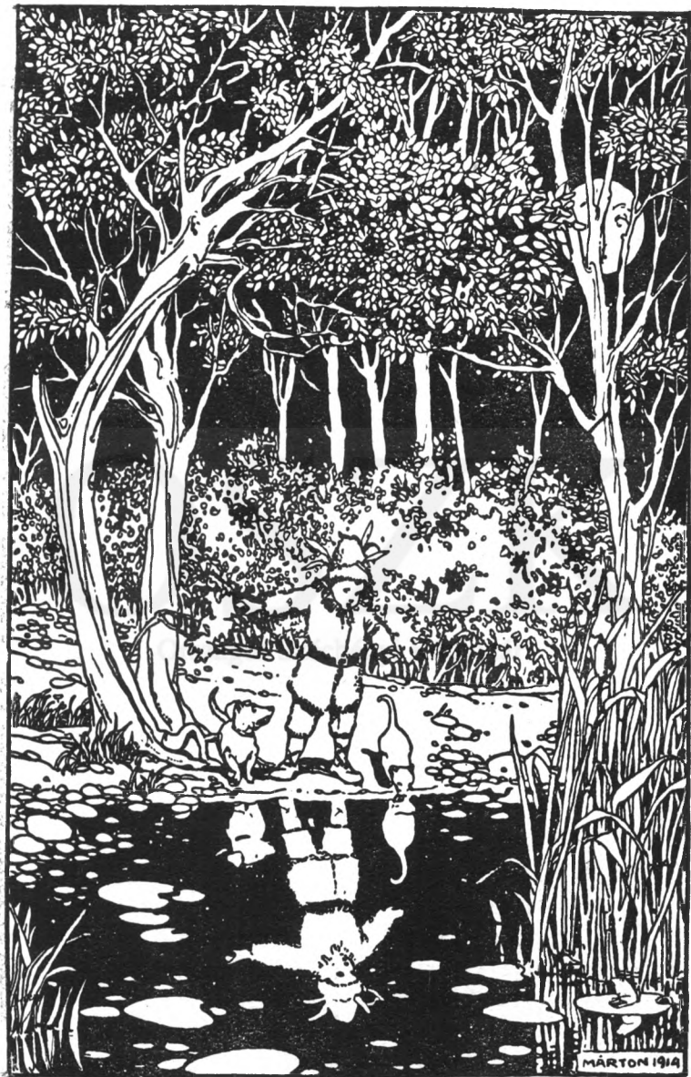
Szajtátva nézte a tündéries képet.