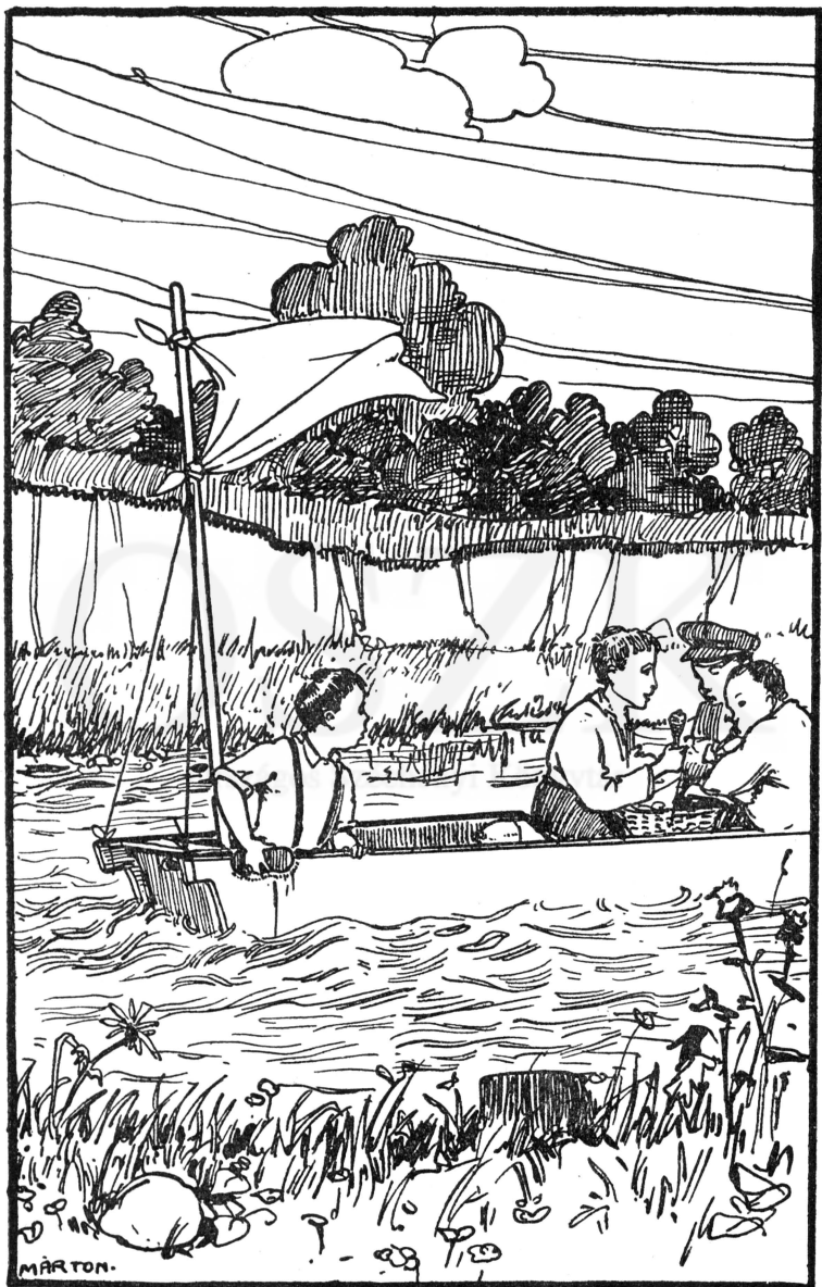
A kapitány s a tisztek vígan lakmároztak.