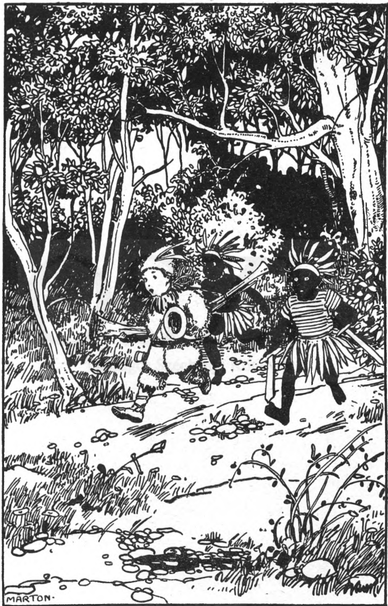
Teljes fegyverzetben elvágattak az Északi-sark felé.