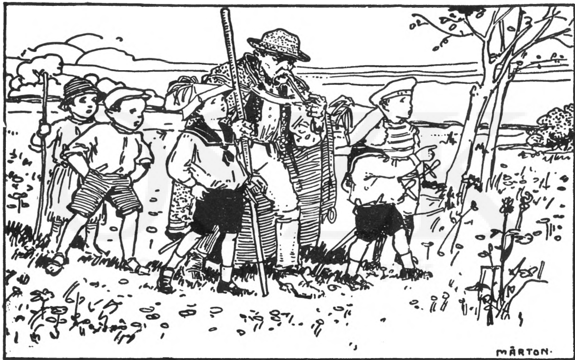
Az öreg Fityula érzékenyülve nézte a szigetet.