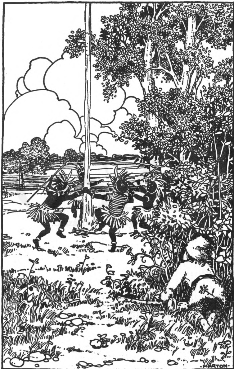
Kényelmesen szemügyre vehette az emberevőket.