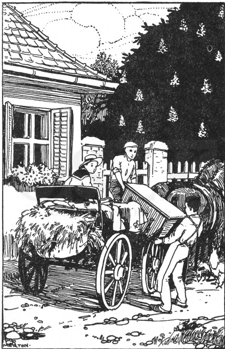
A pántos lúdát az inasok alig-alig bírták a saroglyába emelni.