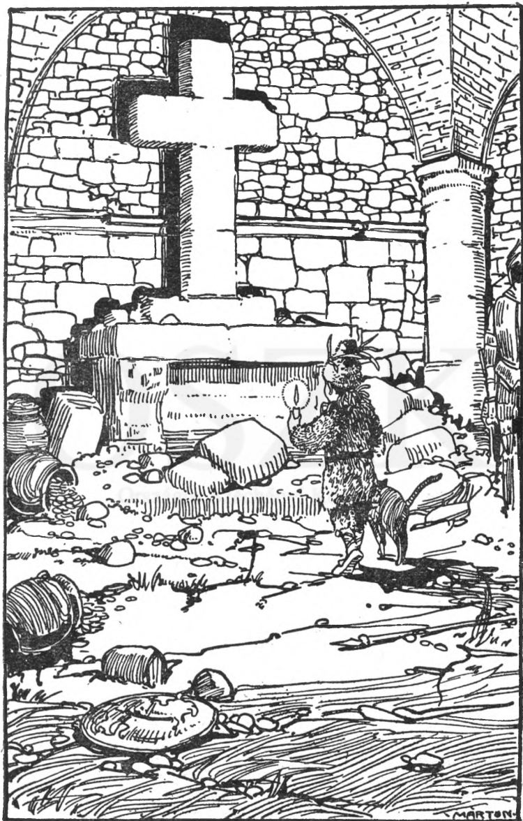
Óriási, a boltozatig erő kökereszt támaszkodott a falhoz.