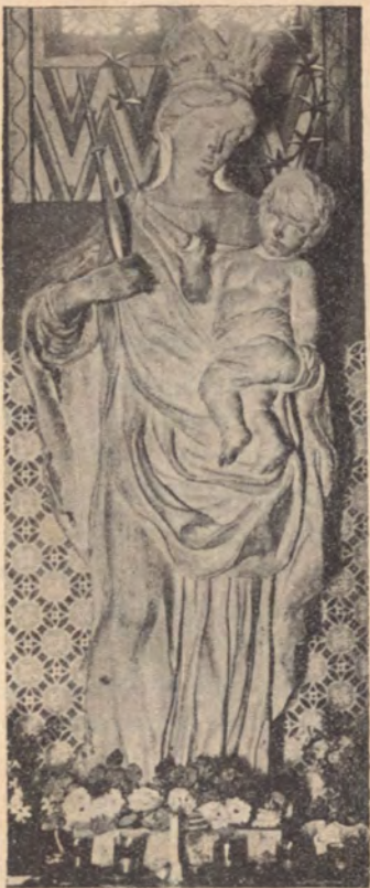
Kegyszobor a budavári Nagyboldogasszony templomban.