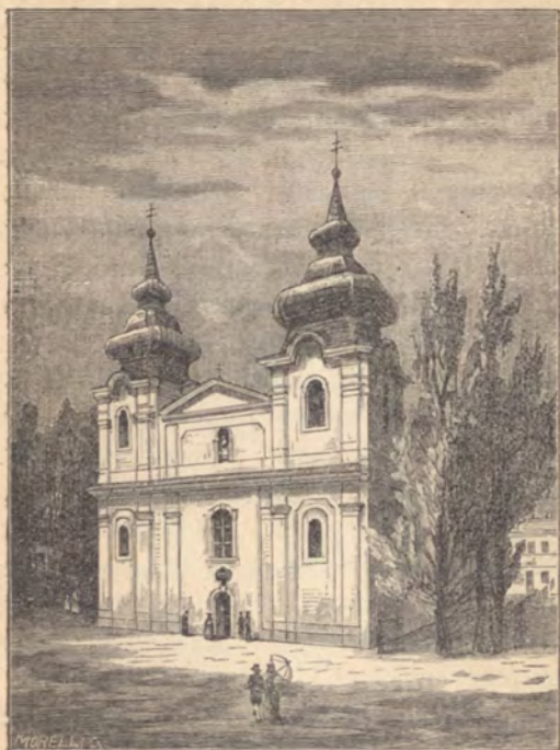
A mátra-verebélyi templom.