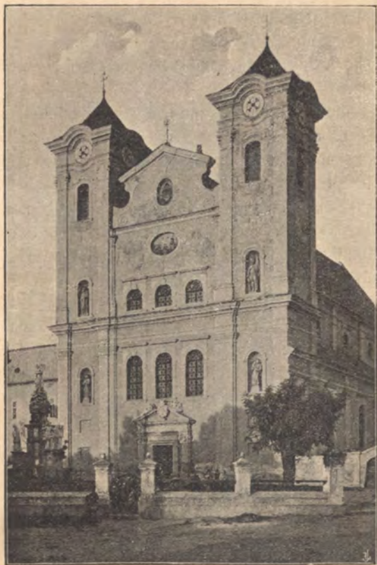
Ferenczrendiek temploma Eperjesen.