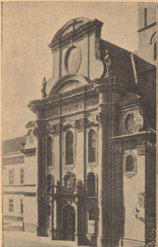
Az eperjesi görög katolikus templom főkapuja.