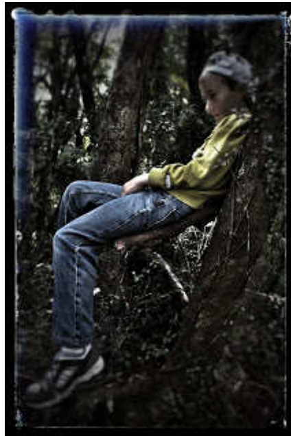
Ágfotelben ül egy WeMúr ;)

Kicsit mindannyian elképedve néztek NyirKosra, mert igaz, hogy vagány volt, de a WeMúrok soha sem tépkedtek a növényeket. Nem voltak ugyan varázserejű lények, de a növények nyelvén értettek valamennyire. Így inkább elkérték, amire szükségük volt. Levelet a levlentyűhöz, kérget a házaikhoz, nektárt a mopp ízesítéséhez. De tépkedni, törni-zúzni, na azt nem szoktak. Inkább segítették a növényeket, levágták a beteg ágaikat, leveleiket, vagy amit félig letört a vihar, és soha, de soha nem vettek el többet, csak ami igazán kellett nekik.