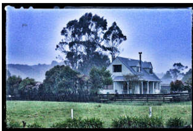
Ilyen egy viharos hajnal Hokitikán, a Hau Hau, vagyis a szelek szellemének utcájában WeMúrföldön ;)

Ott ültek négyen az aprócska házban, és azon gondolkodtak, hogyan történhetett, hogy a bundafánál, ahol mindig balról jön egy rövidke légáramlat, most hirtelen jobbról jött egy hosszú. Azt persze tudnotok kell, hogy a WeMúrok földjén kicsit másképpen működnek a dolgok, mint nálunk. Persze ott is van szél, napsütés, hideg, meleg, eső és hó, de nem úgy változik, mint nálunk az időjárás. Egyik nap esik, a másik nap süt, és sokszor még az időjárásjelentés sem tudja megmondani pontosan, holnap milyen idő is lesz. Vigyél-e ernyőt magaddal, vagy elég a fürdőnadrág. :)