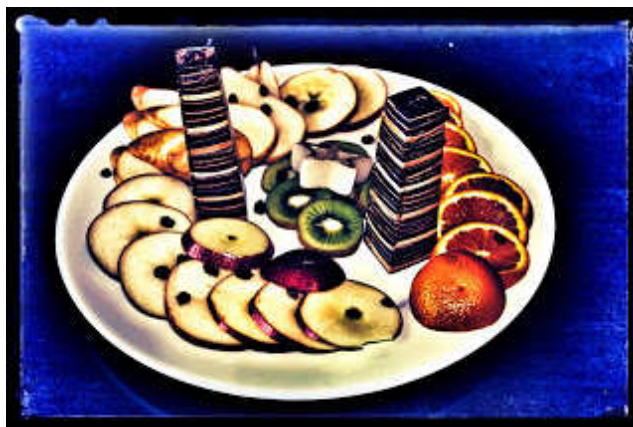
Ebből készül a wreccs

A többiek közben főztek és barkácsoltak, megtanították egymásnak, hogyan is készülnek a legfinomabb krémlevesek és a wreccs.