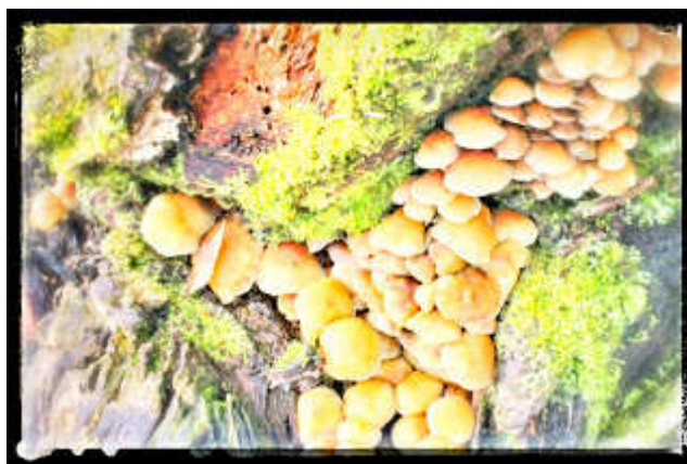
A gombatrambulin, amit Csilla talált ki és le is fényképezett