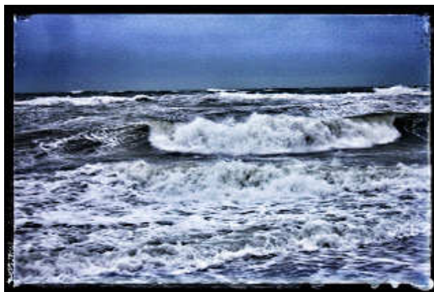
A Tasman-tenger Hokitika partján

ManGic egyre erősebben szorongatta NyirKos derekát, miközben száguldottak egyre feljebb.