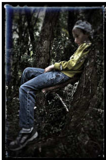
Ágfotelben ül egy WeMúr ;)

Kicsit mindannyian elképedve néztek NyirKosra, mert igaz, hogy vagány volt, de a WeMúrok soha sem tépkedtek a növényeket. Nem voltak ugyan varázserejű lények, de a növények nyelvén értettek valamennyire. Így inkább elkérték, amire szükségük volt. Levelet a levlentyűhöz, kérget a házaikhoz, nektárt a mopp ízesítéséhez. De tépkedni, törni-zúzni, na azt nem szoktak. Inkább segítették a növényeket, levágták a beteg ágaikat, leveleiket, vagy amit félig letört a vihar, és soha, de soha nem vettek el többet, csak ami igazán kellett nekik.