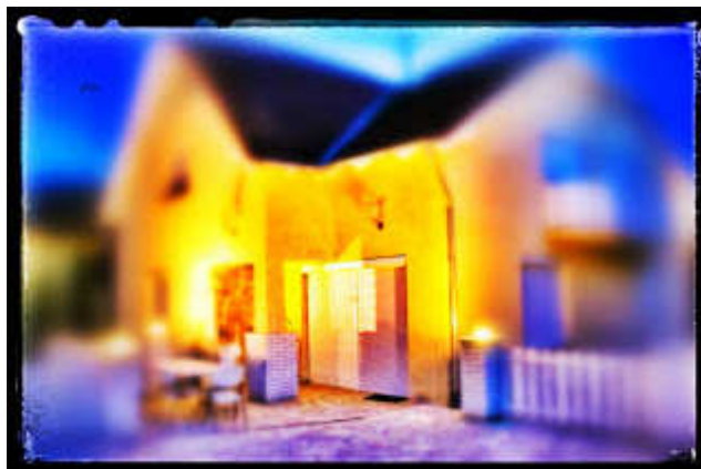
A sárga, piros-tetejű házikó :)

Amikor reggel felébredt mindenki a sárga, pirostetős házikóban és kitörölték a csipát a szemükből, megéreztek a mopp illatát. Leültek az asztalhoz, merengve néztek kifelé a verőfényes napsütésbe.