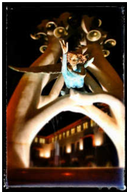
Városi kút Veresegyház közepén, ahol angyalok muzsikálnak

- De érdekes hely! Itt is laknak WeMúrok, ezekben a házakban? - kérdezte ManGic.