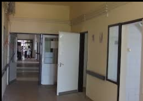
A kórtermek „sétatere”.