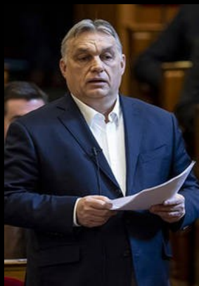
Orbán Viktor, Magyarország miniszterelnöke

Március 13.: a kormányfő bejelentette, hogy március 16-tól bezárják az iskolákat, tantermen kívüli digitális munkarendet vezetnek be, akciócsoportokat állítanak fel és újabb védekezéshez szükséges eszközöket vásárolnak.