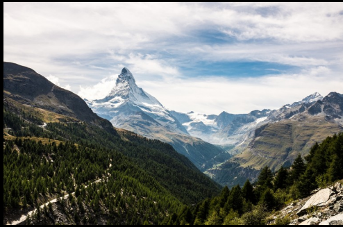
Az égisz érő hegy címlapképe.