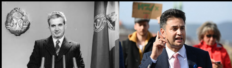
N. Ceaușescu és Márki-Zay Péter.