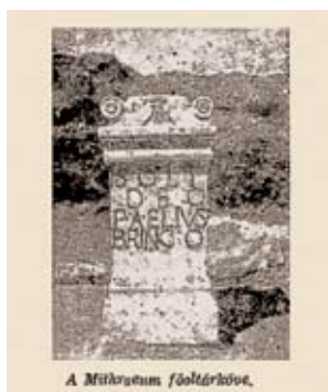
A Mithrasium feltárási képe.

Mikor épült a tétényi országút? címmel érdekes cikket közölt a lap januári száma. Római kori, mérföldtávot jelző oszlopokat találtak, melyek azt bizonyították, hogy községünk országútja a „régí római út nyomán halad... s közel 2000 esztendő”. 33