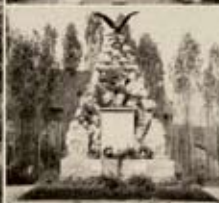
Nagyfőut. Kiváló emlékműve