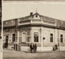
Nagyfőut. Kiváló emlékműve