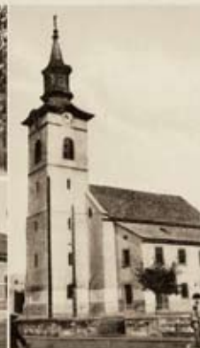
Rím. kat. templom