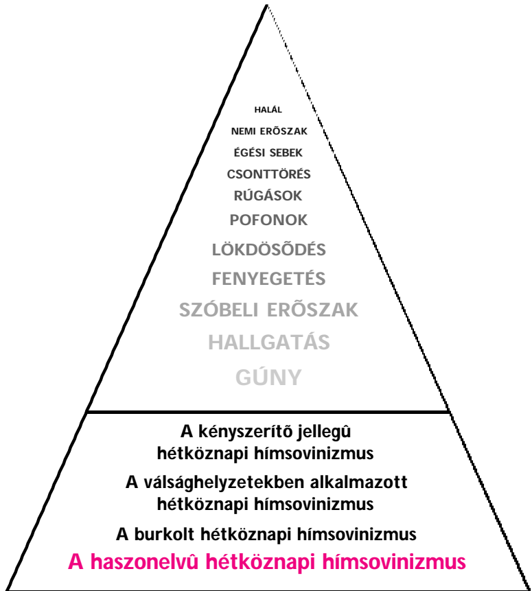
6. ábra: A haszonelvű hétköznapi hímsovinizmus