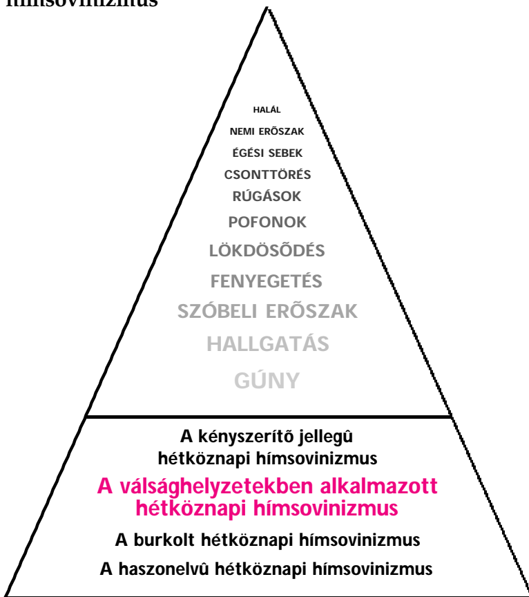
4. ábra : A válsághelyzetekben alkalmazott hétköznapi hímsovinizmus