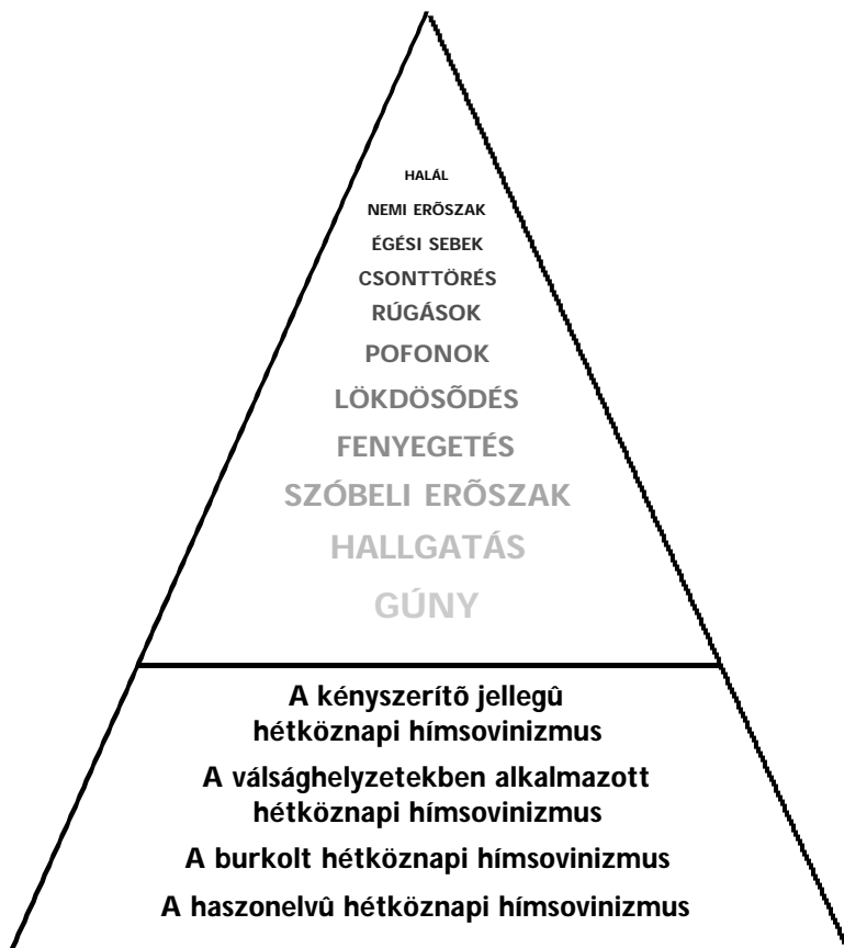
2. ábra: A hétköznapi himsovinizmus válfajai