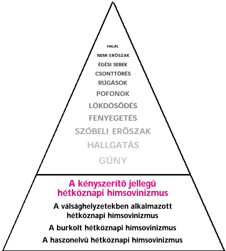
3. ábra: A kényszerítő jellegű hétköznapi hímsovinizmus