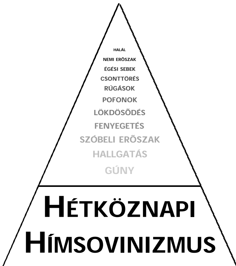
1. ábra: A nők elleni erőszak