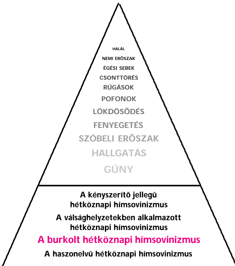
5. ábra: A burkolt hétköznapi hímsovinizmus