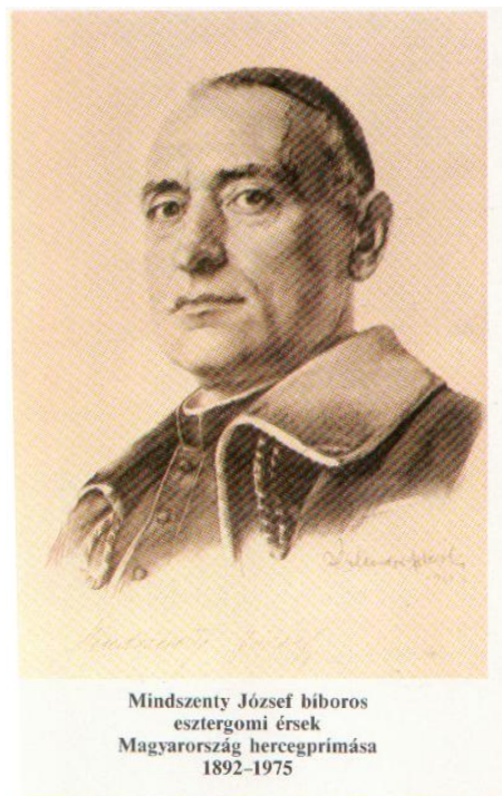
Mindszenty József bíboros esztergomi érsek Magyarország hercegprímása 1892–1975

„Így engedtek el bennünket az útra. Ne féljünk, hogy a reverendánkat sáros csizmájukkal döröglik be, a reverenda edzett ruha. A 40 esztendő átéltek úgy, hogy akik gyaláztak bennünket, elhullottak, vagy elhullanak, akik áldottak minket, azok velünk együtt áldottan élnek. Azért imádkozzatok papjaitokért, általában a papokért, a kispapokért, hogy legyenek hűségesek a jóban, a hívek szolgálatában és Krisztus útjának egyengetésében, amely az egyetlen út az örök élet felé. Ebből a főpásztori szózatból lehet okulni, lehet tanulni!”