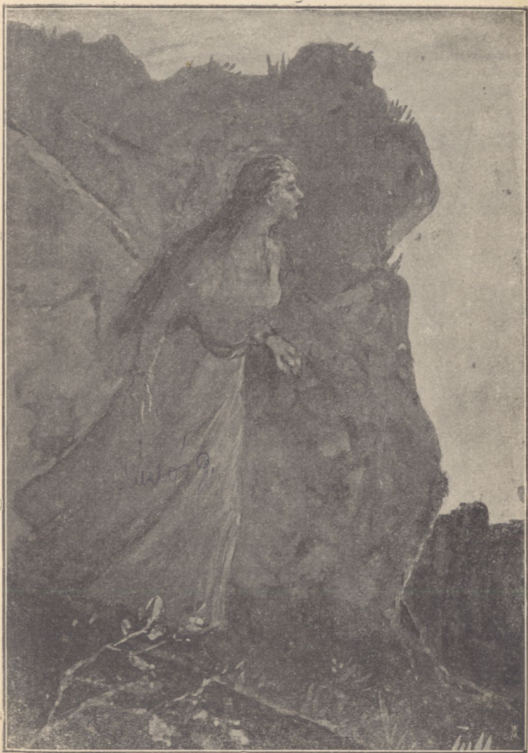
«Hanyatt-homlok rohant le a sziklás hegyoldalon.»