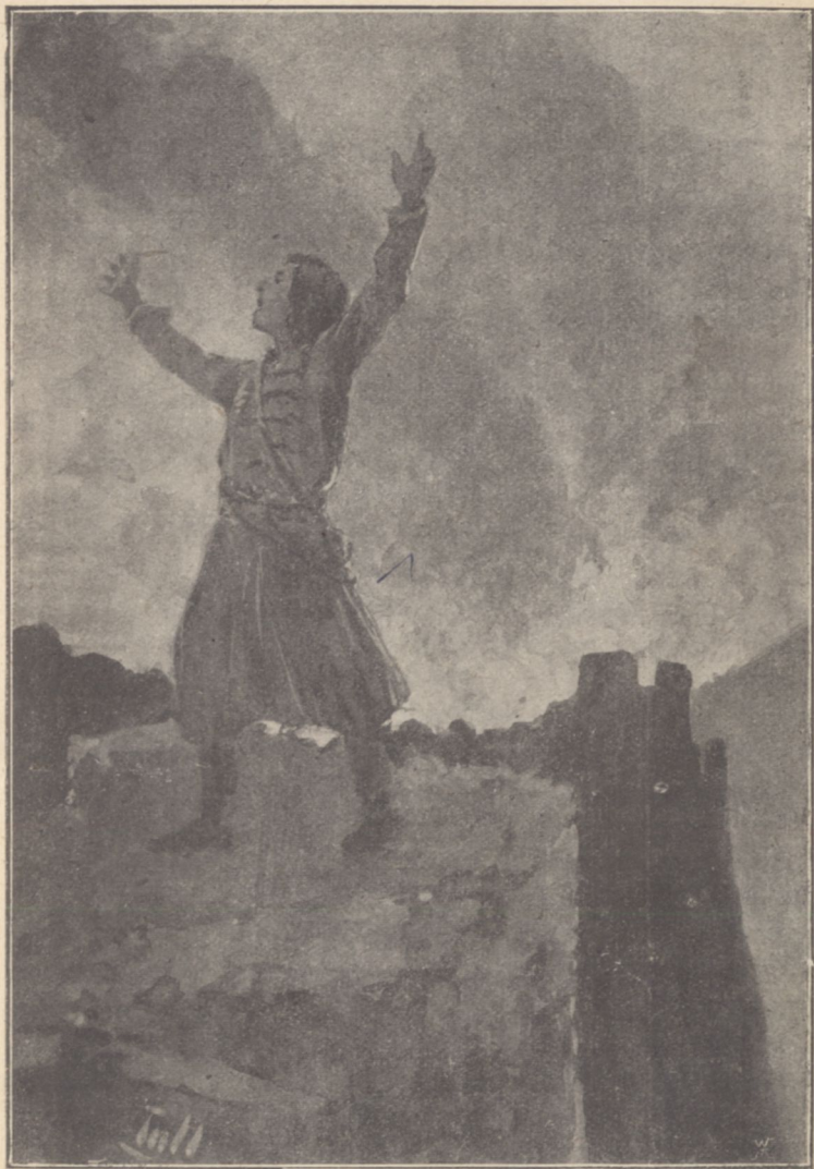
«Ég a falu! kiáltott Csala Mózes.