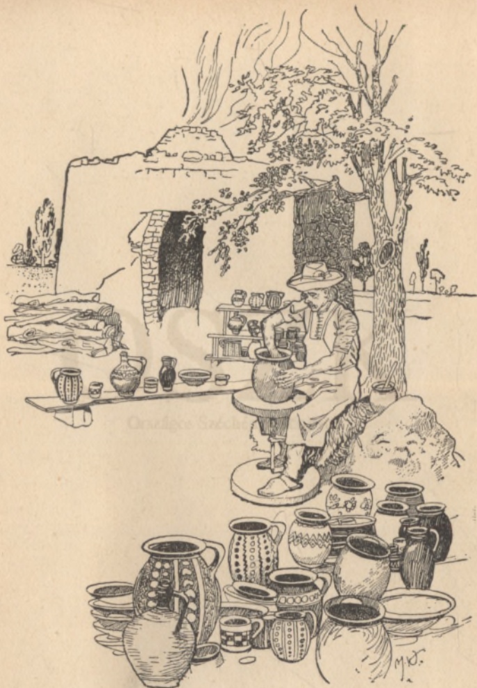
A dévényi fazekas.