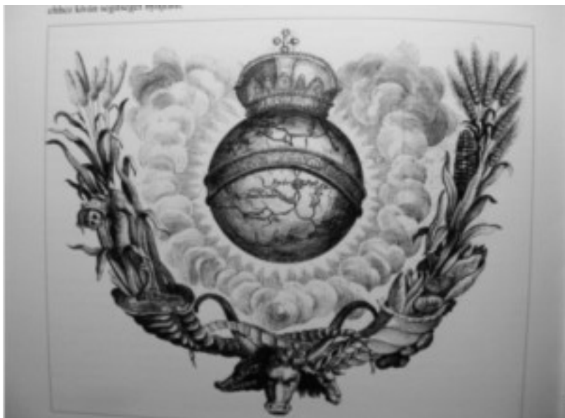
A Szentkoronával megkoronázott Föld. Andreas Nunzer metszete. A Révay Péter Emlékirata 1746-os kiadását díszíti.

„A magyarság a történelem folyamán, mint nemzet is találkozott Máriával Szent István országfelajánlása révén, (...) még a protestáns erdélyi fejedelmek is Mária képét verették pénzeikre, annyira kitörölhetetlenül bele volt vésve a magyar köztudatba, hogy Magyarország Mária országa. Ez a kapcsolat nem üres szólam, jelentőség nélküli képzelgés.” 422