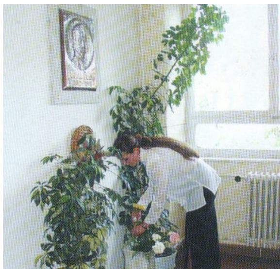
Az ifjúság tiszteletadása a nagy polgármester emléke előtt

A jelen kiadványban szereplő képanyag nem kizárólag az ünnepélyes alkalommal, hanem részben a későbbiek folyamán, más események kapcsán készült.