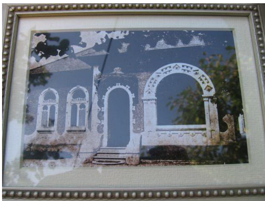
Szerény, ma is lakott szecessziós villája a Czollner-közben