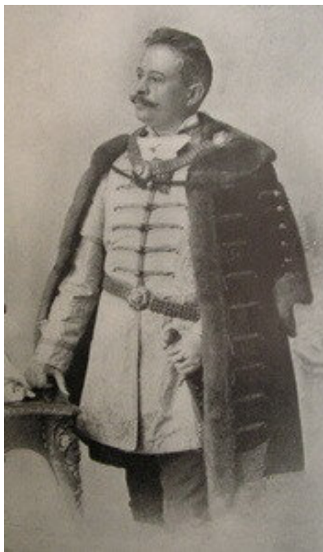
Polgármesterként díszmagyarban - 1897

„Nem a címet köszönöm meg, amit adtak, hanem azt, hogy alkalmat adtak arra, hogy szülővárosomba visszatérhettem s férfikorom delén erőmet szülővárosom szolgálatába bocsáthatom.”