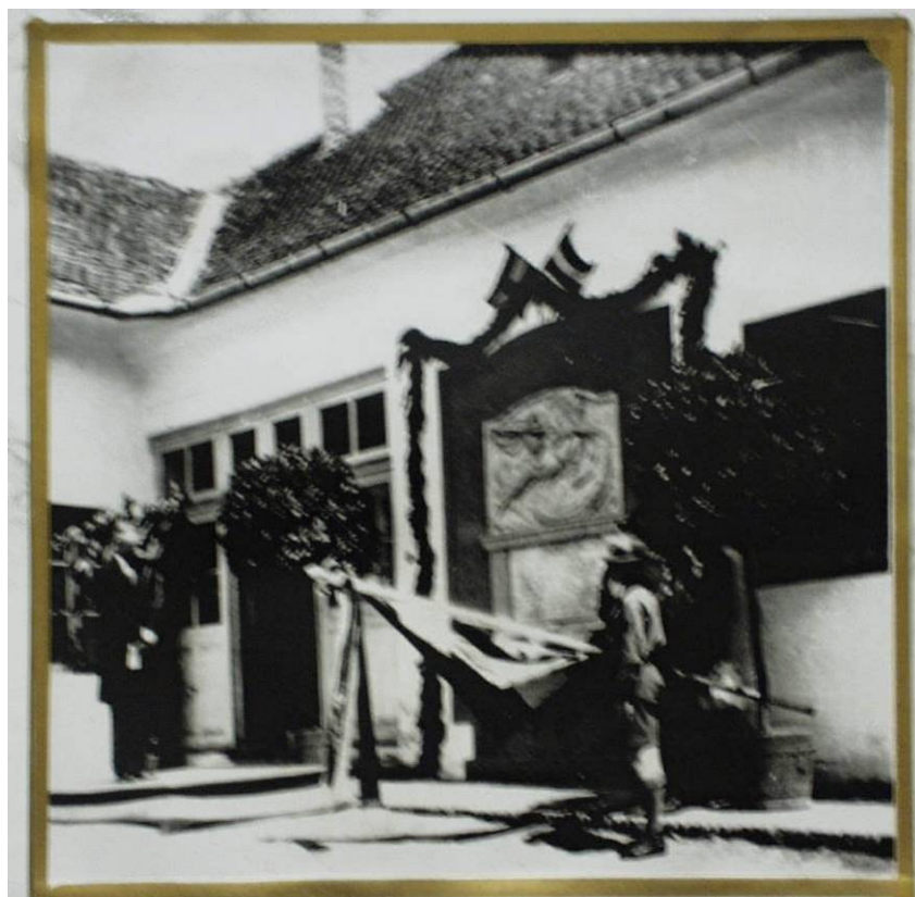
Emléktábla-avatás a Petőfi utcai iskolában - 1933