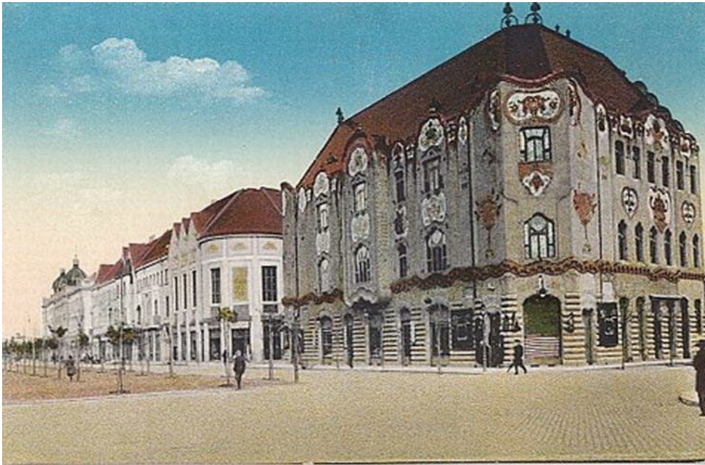
A Rákóczi-út a századelőn

Az 1910-es évek elején már a kimerültség jelei mutatkoztak Kada Eleken. Ezt kifelé jól palástolta nagy akaraterejével. Azonban az ebből az időből származó írásképek jelei már árulkodnak túlterheltségéről. Ő maga nem akart pihenni. Még ekkor is nagy lelkesedéssel, ambícióval telve tervek szöveget. Az események sem engedték meg neki a tétlenséget.