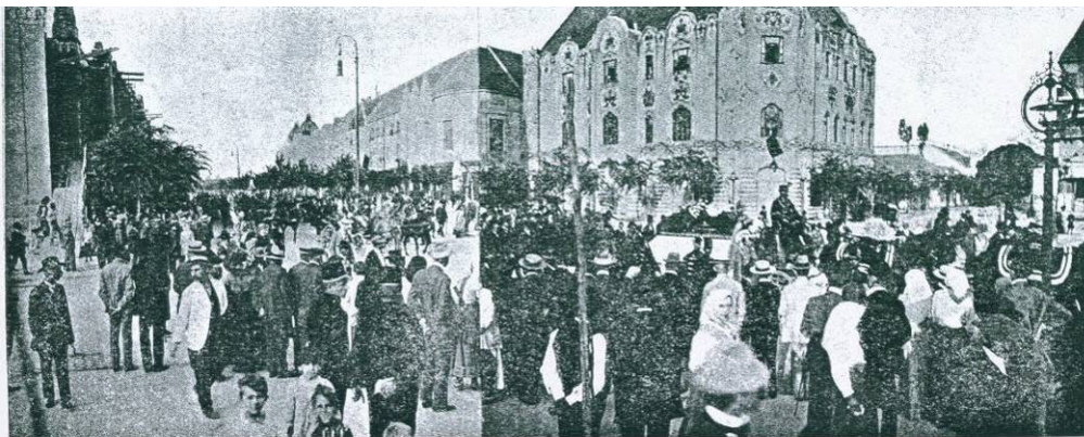
A koporsó beszállítása a városházára.

Halála hírére az egész város gyászba borult. Országos hírű személyek is részt vettek a temetésén, bizonyítva az elhunyt polgármester tekintélyét.