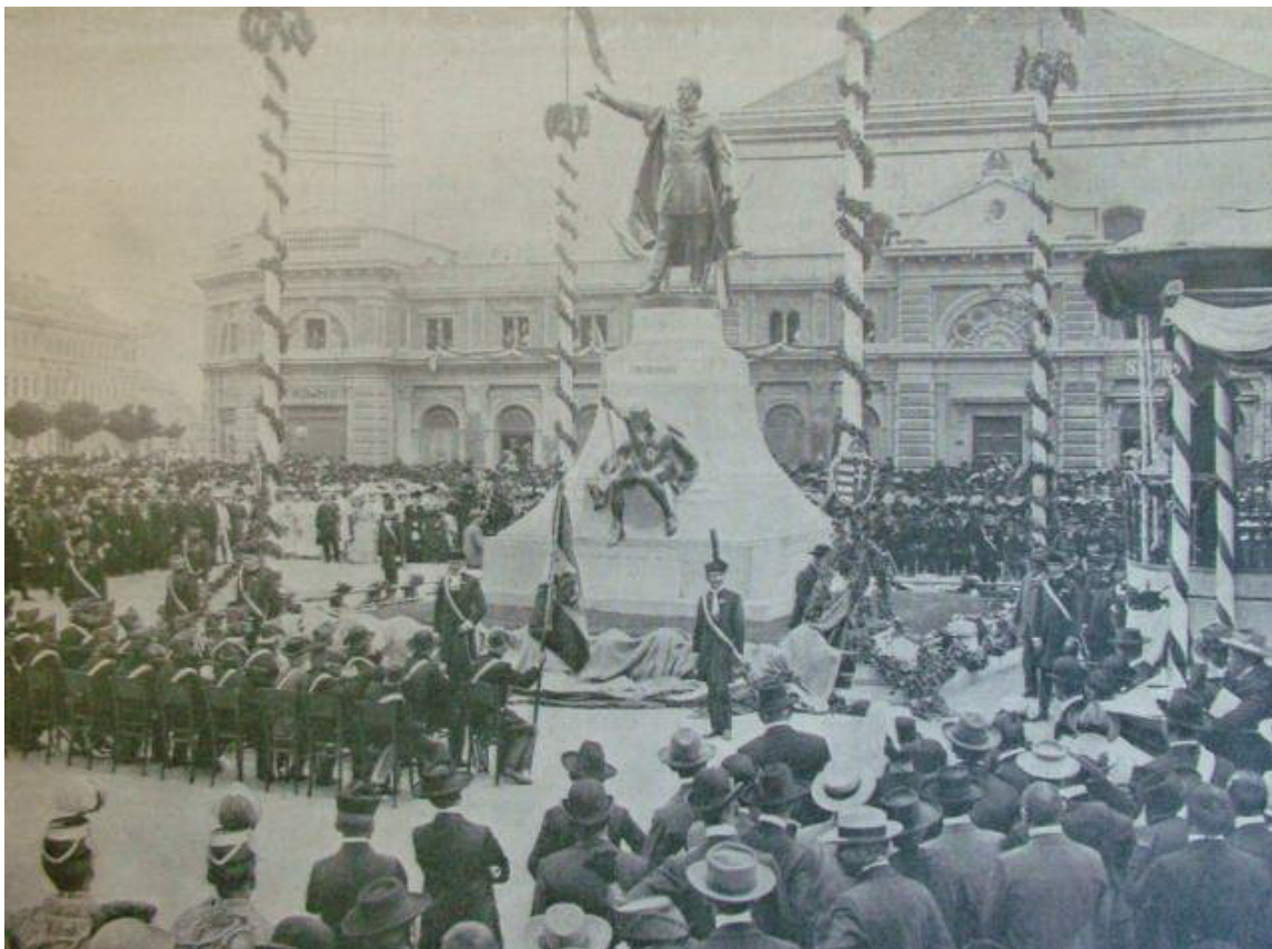
A Kossuth-szobor avatása 1906 július 1-én