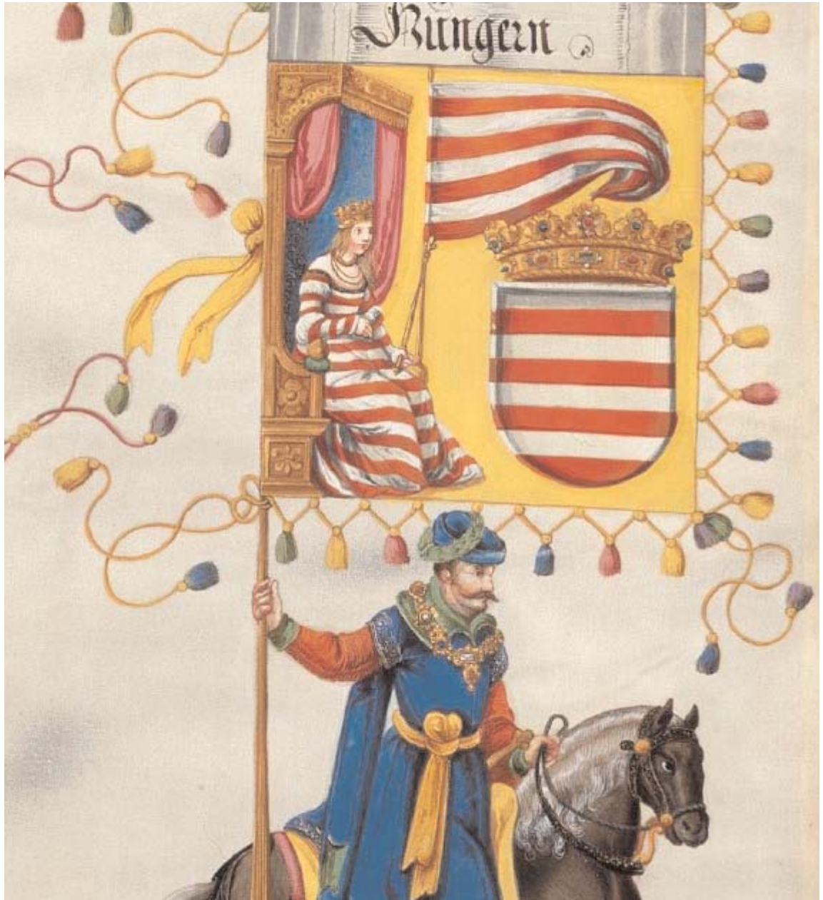
A magyar zászló Miksa császár diadalmenetén