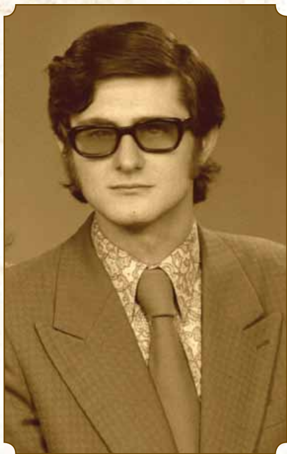
A Kultúrotthon szervezője Szabadka - 1971.