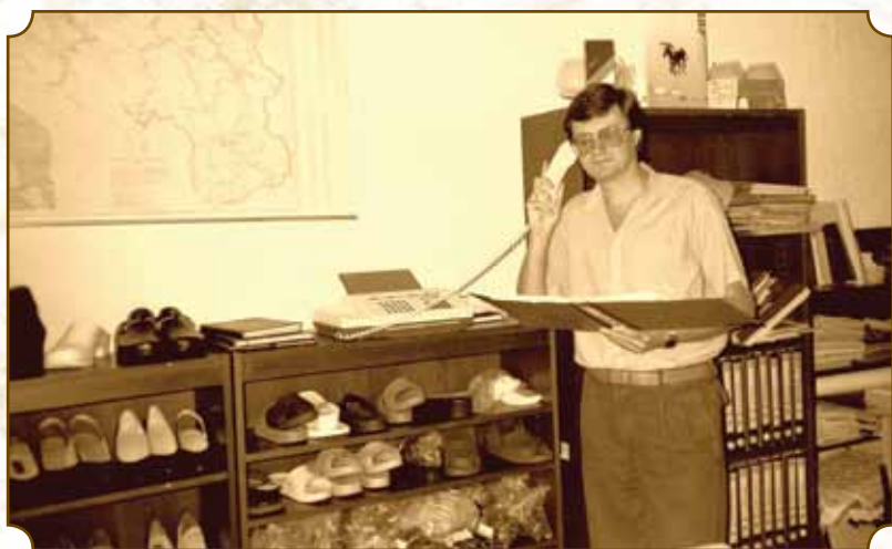
Cipőgyáros Szabadka, 1989.