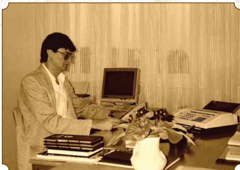
A Trend igazgatója Szabadka, 1990.