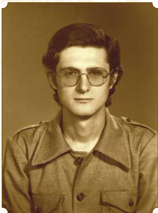
Rádiószerveztő Szabadka, 1969.