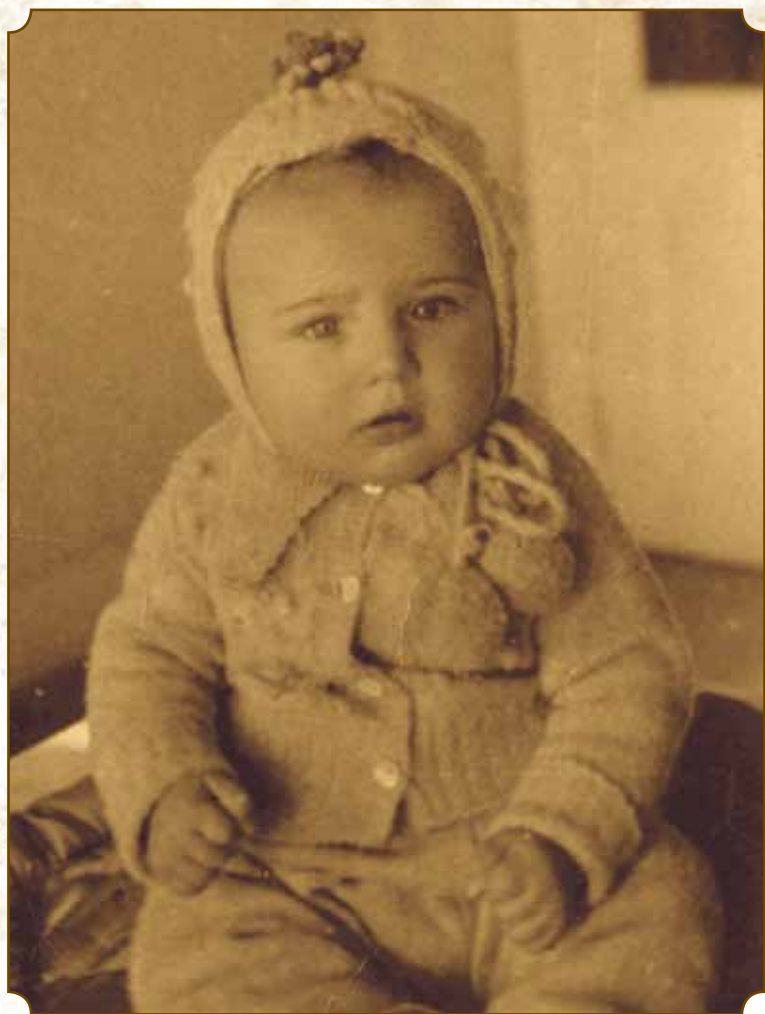
Kishegyes - 1949.