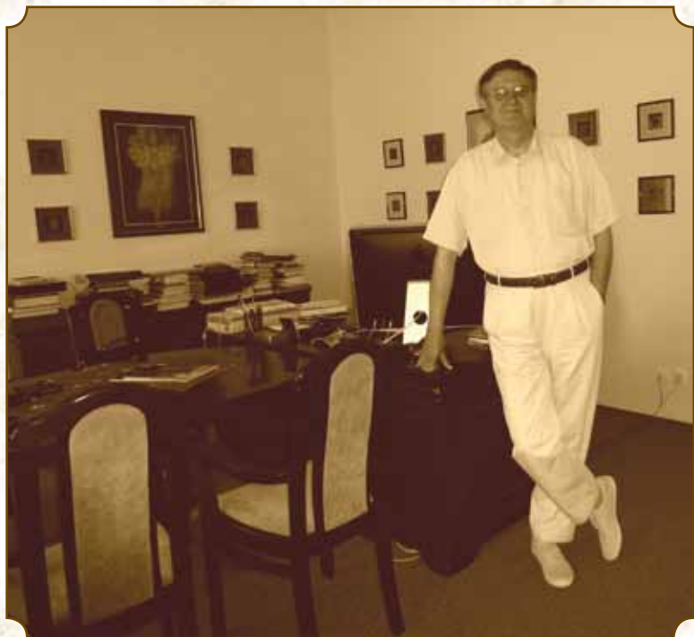
Plazmakutató Szeged, 2010.