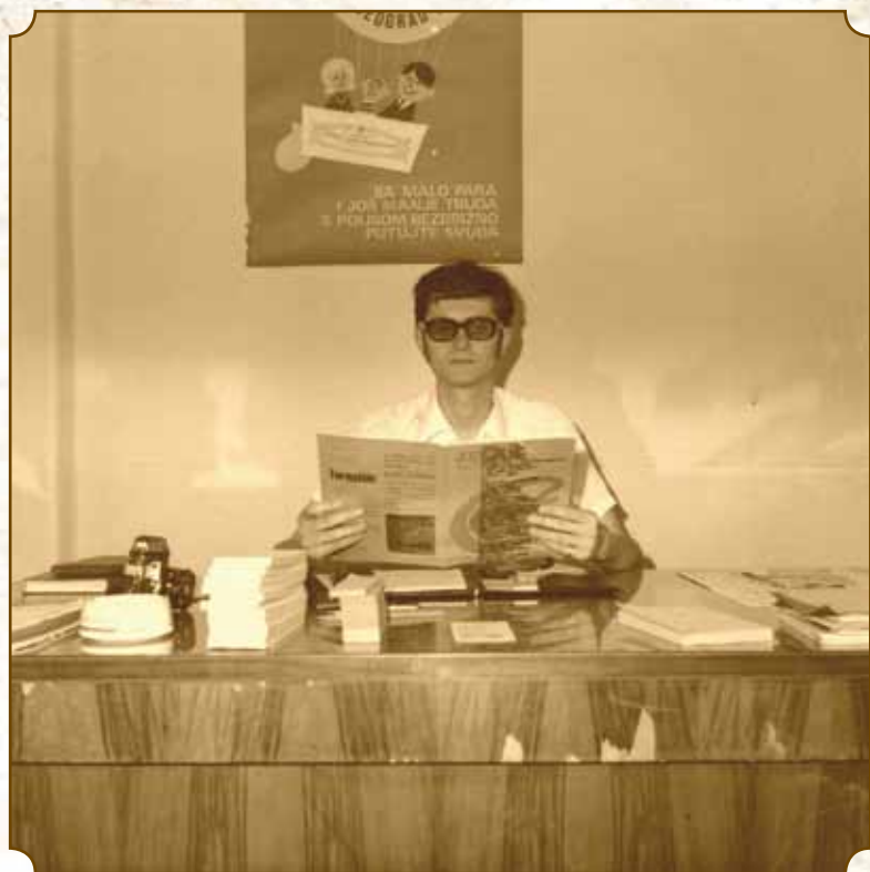
A Jelen szerkesztője Szabadka, 1970.