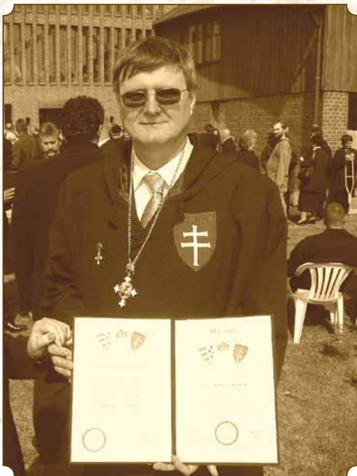
Knightly Order of Saint George 2005.