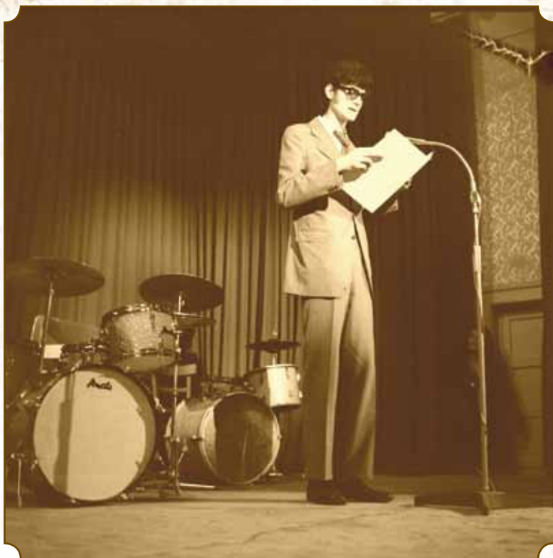
Az Aranymikrofon műsorvezetője Szabadka, 1971.