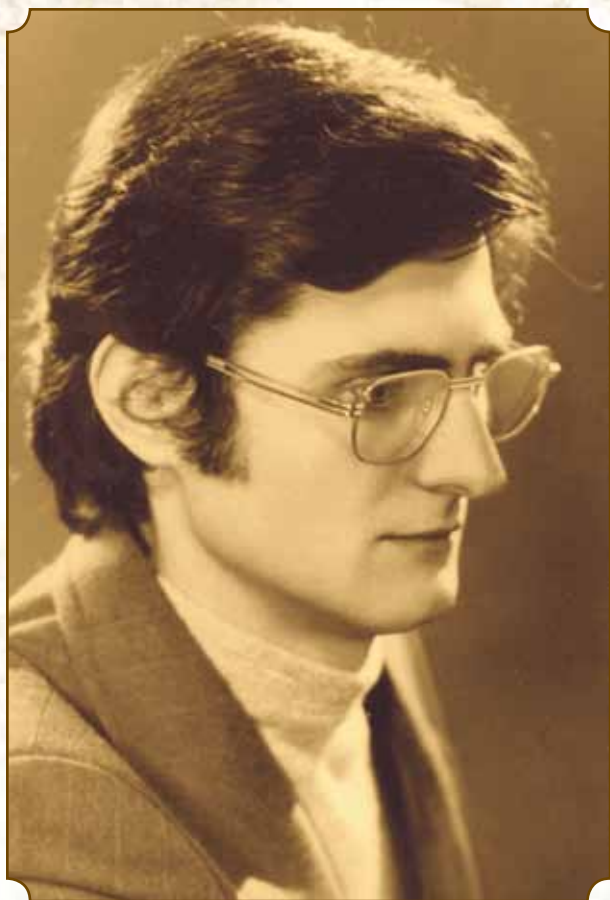
Lapszerkesztő Szabadka, 1974.