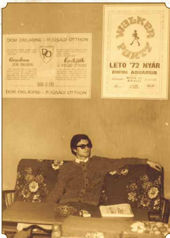
Műsorrendező Szabadka, 1973.