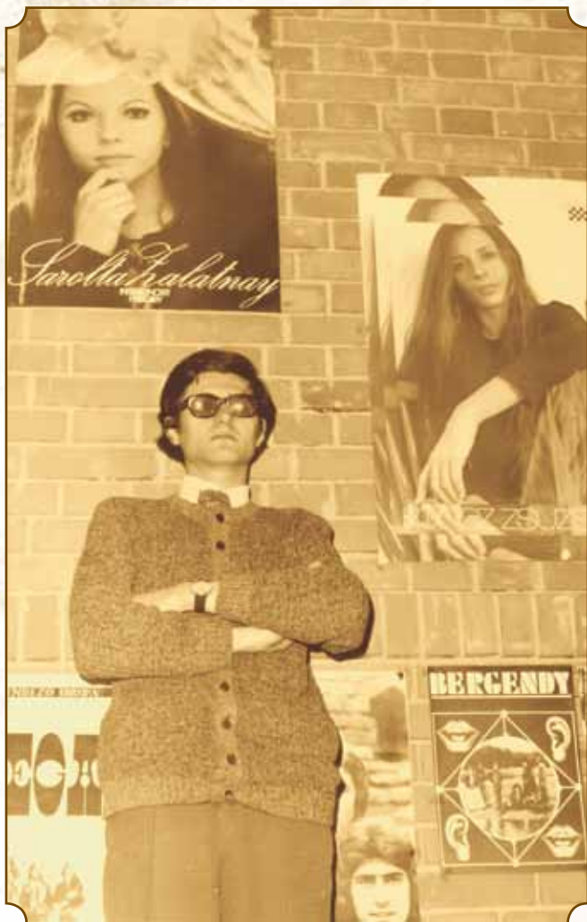
Koncertszervező Szabadka, 1973.