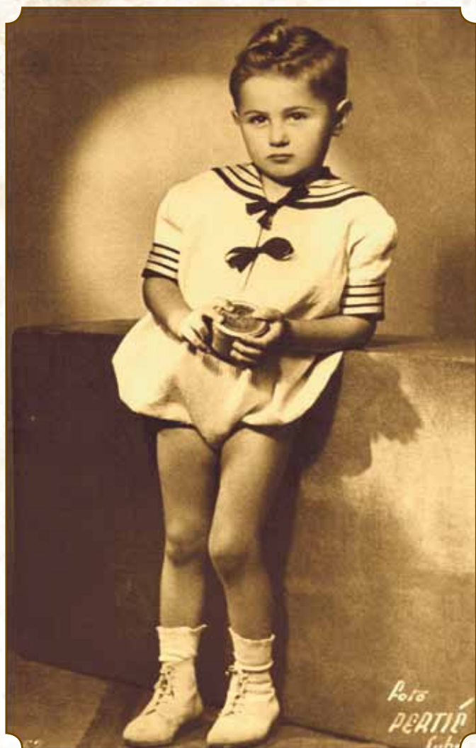
Kishegyes - 1952.