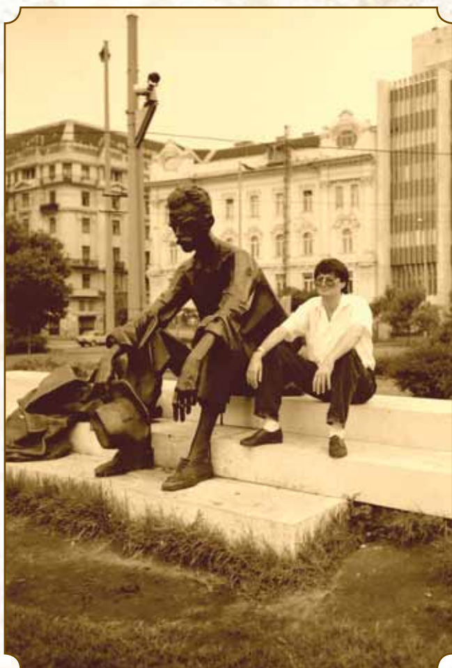
József Attilával Budapest, 1991.