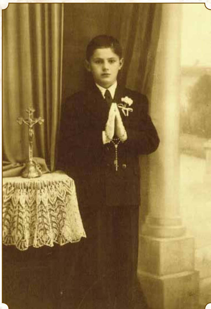
Kishegyes - 1959.