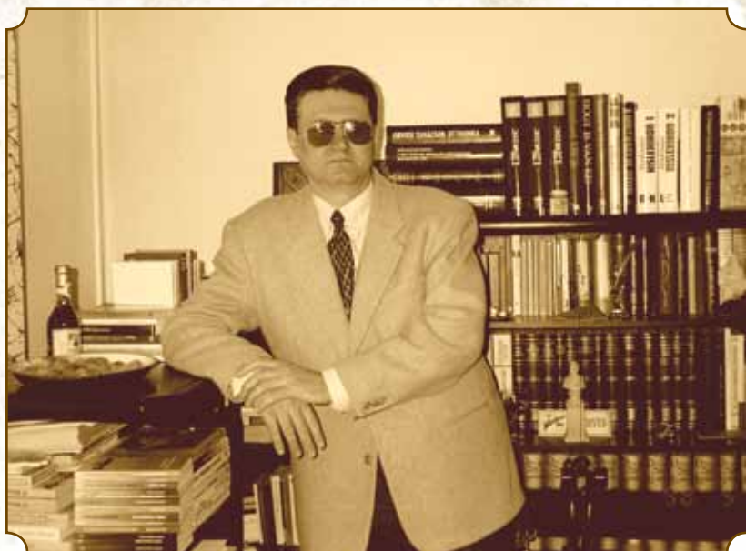
Könyvkiadó Szeged, 1996.